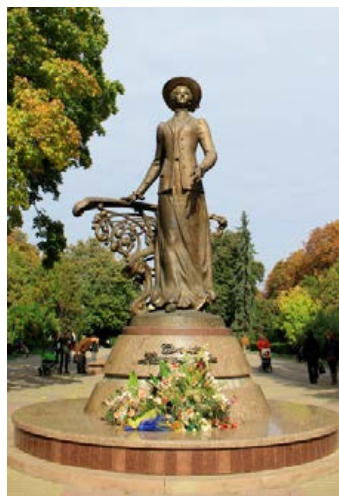
Пам'ятник Соломії в Тернополі

Уже через рік Крушельницька співала головні партії на визнаних найкращими оперних сценах Італії. Тріумф, якого вона досягла в цій країні, відчинив перед нею двері провідних театрів багатьох країн світу.