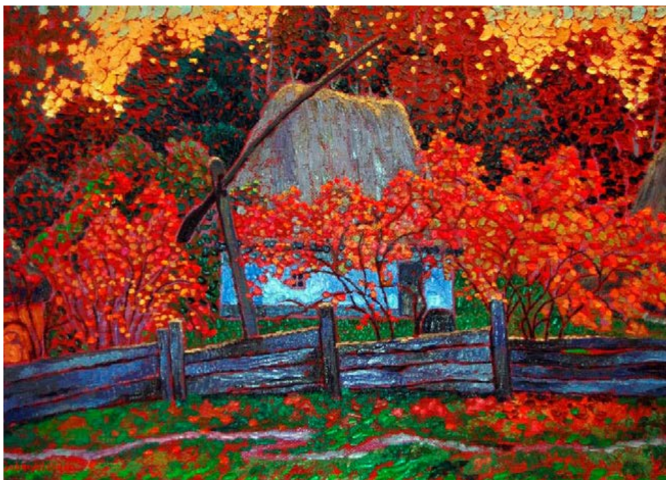
Дмитро Добровольський. Червона калина (репродукція)