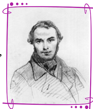
Тарас Шевченко. Автопортрет (репродукція)

До мене сьогодні всміхнувся Шевченко з картини, що там на стіні. Читає пісні його залюбки ненька, розказував батько мені: як вівці він пас — ще малий був хлопчина, а виріс — великий дав дар: для всіх поколінь, для всієї України, цю книгу, що зветься «Кобзар». Як книгу святу берегли ми завзято, з собою забрали у світ, як слово Тараса завжди зберігати, великий усім заповіт. Буду й я любити Україну рідненьку, то, може, й мені ще не раз з картини ласкаво всміхнеться Шевченко, наш Батько, великий Тарас.