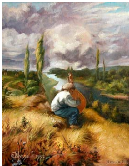
Олег Шупляк. Кобзар (репродукція)