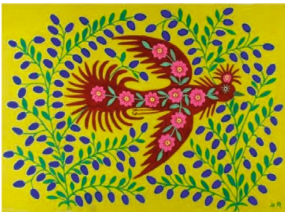
Марія Приймаченко «Галочка літає, господаря шукає» (репродукція)