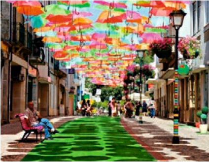
Інсталяція у м. Агеда

2012 року на одному з бульварів португальського міста Агеда компанія «Sextafeira» створила яскраву інсталяцію* з кольорових парасольок, які повисли над вулицею, захищаючи людей від спеки та дощів. Ця ідея дуже сподобалася мешканцям Агеда і численним туристам.