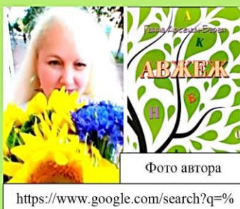
Фото автора https://www.google.com/search?q=%

• Жанр - тавтограма (вірш, усі слова якого починаються однією й тією самою буквою).