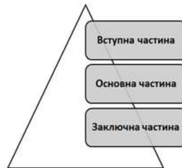
Рисунок 2. Структура заняття

Структуру кожного заняття подано на рис. 2.