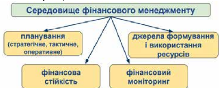
Рис.2. Середовище фінансового менеджменту закладу освіти, яке необхідно поліпшувати

підвищення якості освітніх послуг і самого освітнього середовища можливе завдяки зміні механізмів управління та фінансування на основі запровадження соціальних і освітніх стандартів, нових фінансових підходів і, що досить важливо, є поступове набуття повної автономії закладу освіти, яка передбачена ст. 23 Закону України «Про освіту». Звичайно, що у світлі згаданого кожен керівник змушений бути ефективним менеджером у забезпеченні розвитку закладу освіти, використовуючи всі наявні можливості, передбачені законодавством автономії, особливо у частині фінансової її складової. Так, для більшості керівників закладів загальної середньої освіти є затребуваним підвищення їхнього рівня компетентності з напрямку фінансового менеджменту, виходячи з існуючих реалій, що потребує значної уваги щодо її компенсації (рис.2).