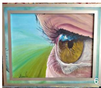
Назви картин: 1. «Вогняний водоспад». 2. «Думки мої тихі». 3. «Подорож Бедрика». 4. «Мелодія Землі». 5. «Пульт Нації». 6. «Дзеркало душі».