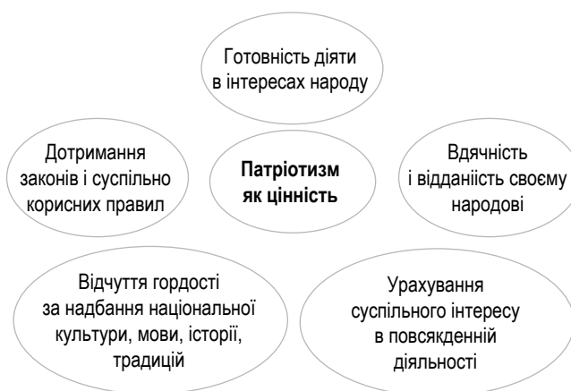
Рис. Характеристика патріотизму як цінності

На відміну від передавання географічних знань, цінності можливо успішно впроваджувати у свідомості здобувачів освіти лише наскрізно, через настановлення й особистий приклад учителя.