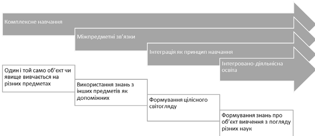
Рис. 1. Етапи становлення поняття інтеграції в освіті

Отже, можна визначити основні характеристики кожного з етапів розвитку поняття інтеграції в освіті (Рис. 1). Водночас можна простежити умовно відокремлені етапи розвитку поняття інтеграції в освіті, проте термінологія і розуміння даного поняття попередніх етапів використовується на кожному наступному етапі, тобто відбувається не переродження розуміння поняття, а його збагачення і доповнення новими характеристиками. Ці всі поняття є дуже близькими за значенням і між ними не можна провести чіткої межі.