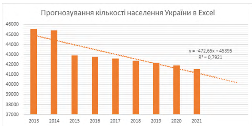
Рис. 3. Зразок прогнозування кількості населення в електронній таблиці

фічних процесів в Україні та вміння їх досліджувати з використанням математичного апарату та цифрових технологій.