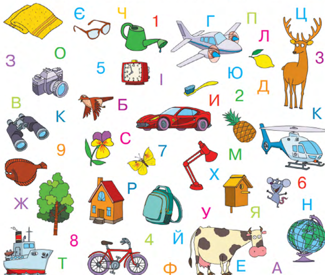
(Бібік, 2019, с. 7).

Знайди на малюнках першу букву свого імені; цифру — скільки тобі років. По черзі скажіть, що із зображеного не належить до природи. Що можна назвати словом транспорт ? З перших букв назв яких предметів можна скласти слово школа ?