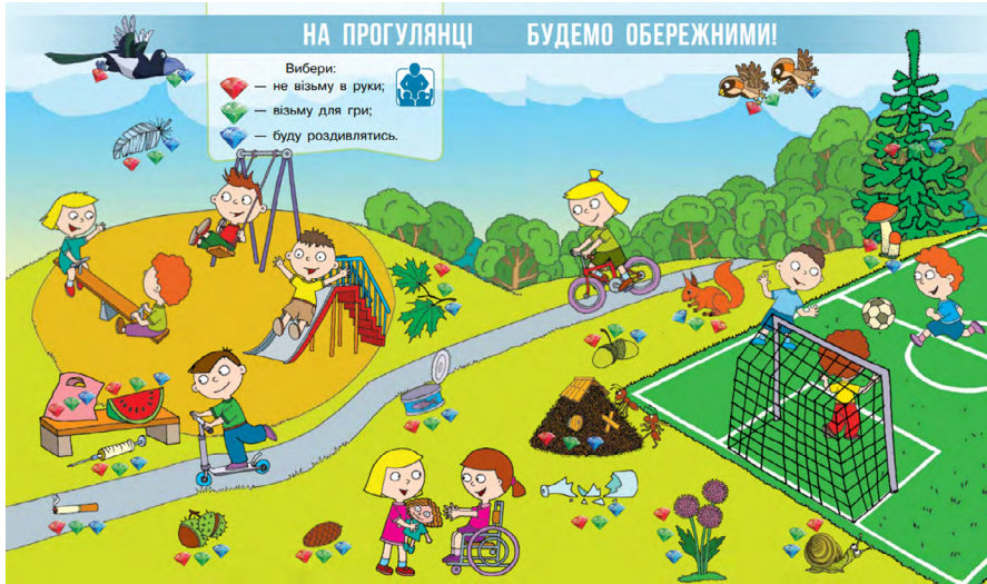
(Бібік, 2018, с. 16–17).

Знайди на малюнках першу букву свого імені; цифру — скільки тобі років. По черзі скажіть, що із зображеного не належить до природи. Що можна назвати словом транспорт ? З перших букв назв яких предметів можна скласти слово школа ?