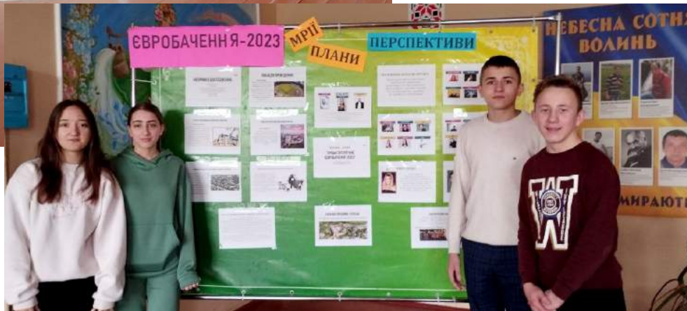
Фото 3. Дев'ятикласники на шкільному захисті проектів