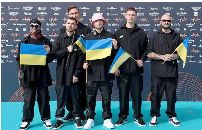
Фото 1. Гурт «Калуш оркестра» 2022 року в Турині

Пісенний конкурс Євробачення в Україні вже давно став визначною подією, яка щороку привертає увагу національних ЗМІ та широкого глядацького загалу. Вперше представник України взяв участь у конкурсі в 2003 році – Олександр Пономарьов тоді піднявся лише на 14 позицію. Наступного року в турецькому Стамбулі Руслана Лижичко перемогла, заспівавши пісню «Дикі танці». Завдячуючи цій перемозі, Україна вперше отримала честь 2005 року приймати співочий конкурс у себе [3]. У 2016 році на Євробаченні перемогла Джамала. У 2022-му конкурс виграв гурт «Калуш оркестра». Зі сцени в Турині, усупереч правилам, український гурт сколихнув увесь світ закликком «Help Azovstal right now». Ми пишаємося вчинком співвітчизників, який дав надію на порятунок сотням захисників.