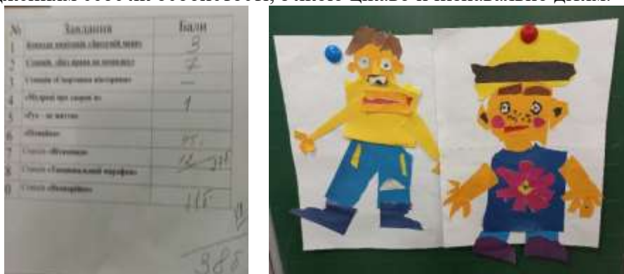
Рис. 6. Квест «Ми за здоровий спосіб життя». Маршрутний лист. Рефлексія «Хворійко і Нехворійко»

Використання класними керівниками та вчителями для виховних заходів інтерактивних вправ «СЕНКАН», «Так чи ні», «Займи позицію», «Рольова гра», «Цікаві квадрати», «Голосуй ногами», «Заземлення», «Муха», «Обійми», метод Lego «6 цеглинок», гра «LIKE /DISLIKE», «Асоціативний кущик», «Асоціативне гроно», «Фішбоун», дискусійна сітка ЕЛВЕРМАНА, ментальні карти, квест «Принеси предмет», «Колесо емоцій», гра «Камінь – ножиці – папір», використання платформи «Kahoot», фізкультхвилинки музичної релаксації та дії є підтвердженням себе як особистості, з якою цікаво й пізнавально дітям.