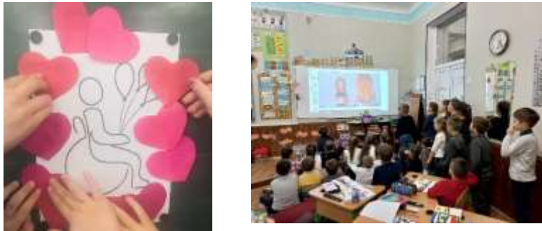
Рис 5. Проєкт «Суспільство без бар'єрів»

Соціально-психологічний супровід учнів з особливими освітніми потребами здійснюють соціальний педагог і практичний психолог (рис. 5).