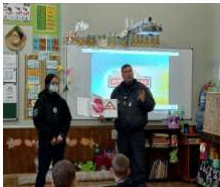
Працівники дорожньо- патрульної служби в гостях у початковій школі

У рамках профілактично-роз'яснювальної роботи щодо запобігання травматизму на залізничному транспорті, територіях вокзалів, станцій у нашому ліцеї були проведені виховні заходи «Безпека дітей на залізниці», «Залізнична колія – зона підвищеної небезпеки».