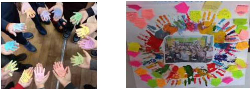
Рис 4. Акції «16 днів без насильства»

Мета проведення акції «16 днів без насильства» – привернення уваги учнів до проблем насильства в дитячому та учнівському колективах і протидії насильству в сім'ї. Будьте уважними до людей, а особливо дітей, які вас оточують, та не залишайте їх у біді (рис. 4).