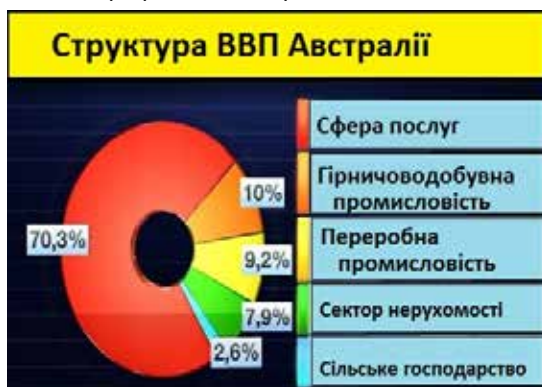
Рис. 3. Структура ВВП Австралії

Австралія є економічно високорозвинутою країною. Країна має аграрно-сировину спеціалізацію на світовому ринку товарів та послуг. Позитивне значення в економічному розвитку набуває також відносна близькість Австралії до країн Південно-Східної і Східної Азії та Океанії. Структура господарства Австралії цілком сучасна і відповідає критеріям високорозвинутих країн. Робота з графічним матеріалом