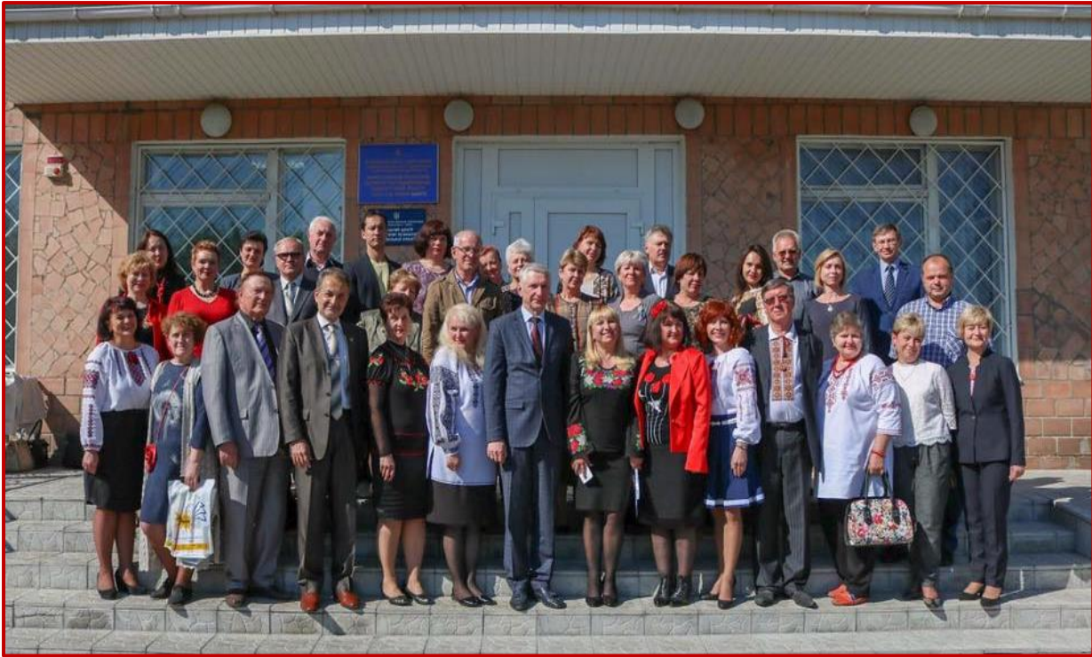
25 років кафедри філологічних дисциплін та методики їх викладання (16 травня 2017 р.)