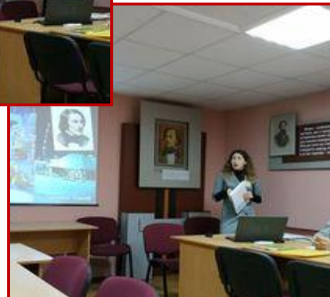
Конкурс «Учитель року – 2020» у номінації «Зарубіжна література»