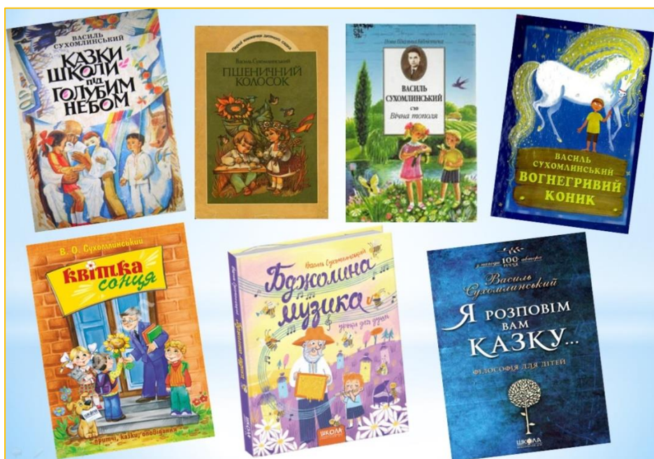
Фото 9. Книги Василя Сухомлинського для дітей

Василь Олександрович Сухомлинський – не лише видатний учений і педагог, а ще й талановитий дитячий письменник. Як свідчення цьому – величезна кількість книг різних років і видавництв для дітей. Казками та оповіданнями Сухомлинського, такими легкими, простими і доступними, зачитувалося (та й нині зачитується!) не одне покоління дітей і батьків. Переконані, що ці книги – неоціненний дар, отриманий нами в спадок від видатного педагога Василя Сухомлинського (див. фото 9).