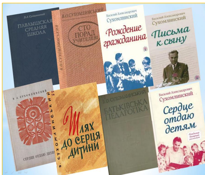
Фото 4. Книги Василя Сухомлинського