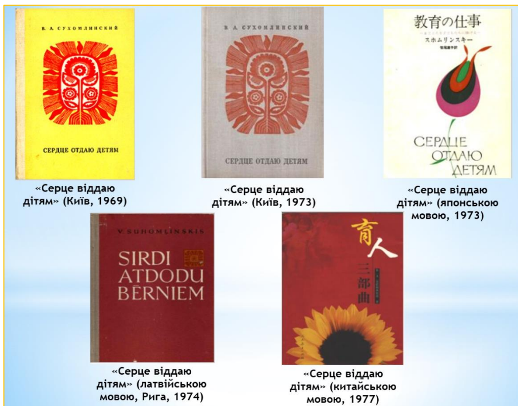
Фото 6. Книга «Серце віддаю дітям», видана у різні роки різними мовами

Книга «Серце віддаю дітям» складається із двох частин: «Школа радості» та «Роки дитинства», де пропонується опис роботи «Школи під блакитним небом» як творчої лабораторії, в якій розвиваються креативні здібності школярів через гру, природу, фантазування. Значна увага приділяється здоров'ю підростаючого покоління, яке потрібно загартовувати як у школі, так і в позаурочний час.