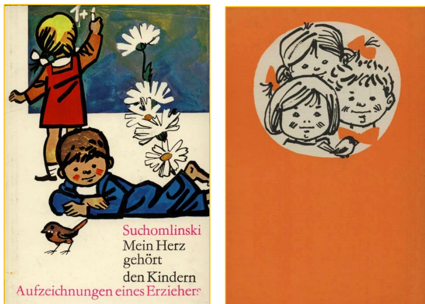
Фото 5. Обкладинка та тверда палітурка першого видання книги «Серце віддаю дітям» німецькою мовою (Берлін, 1968)

Однак найвідомішою працею директора із Павлиша стала книга «Серце віддаю дітям». Уперше вона побачила світ у 1968 році в німецькому видавництві «Volk und Wissen» у Берліні німецькою мовою під назвою «Mein Herz gehört den Kindern» (див. фото5).