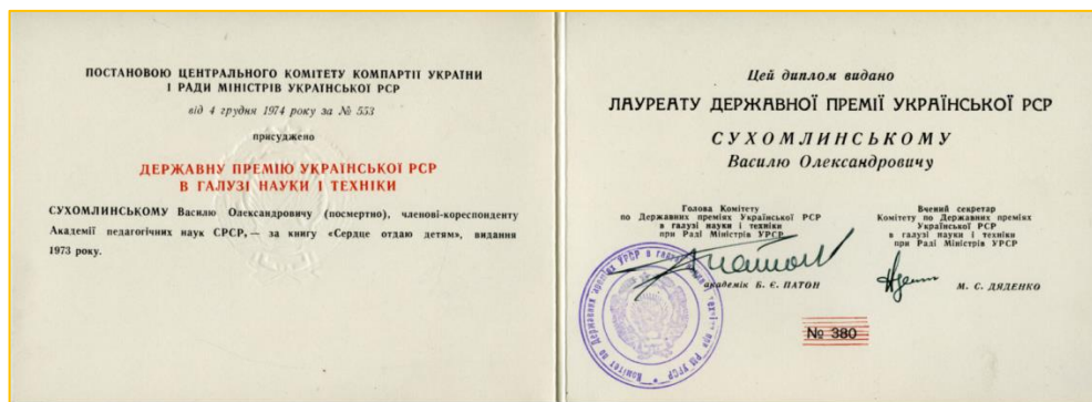
Фото 7. Диплом лауреата Державної премії УРСР за книгу В. Сухомлинського «Серце віддаю дітям» (1974)

У 1974 році за цю працю Василь Сухомлинський був удостоєний Державної премії УРСР в галузі науки і техніки (помертвено) (див. фото 7).