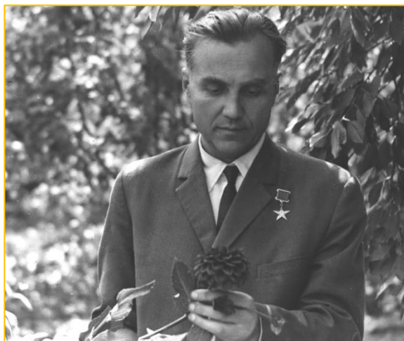
Фото 1. Василь Сухомлинський

Усі найкращі риси, притаманні людині, як-от людяність, співчутливість, привітність, чуйність, доброзичливість, скромність,