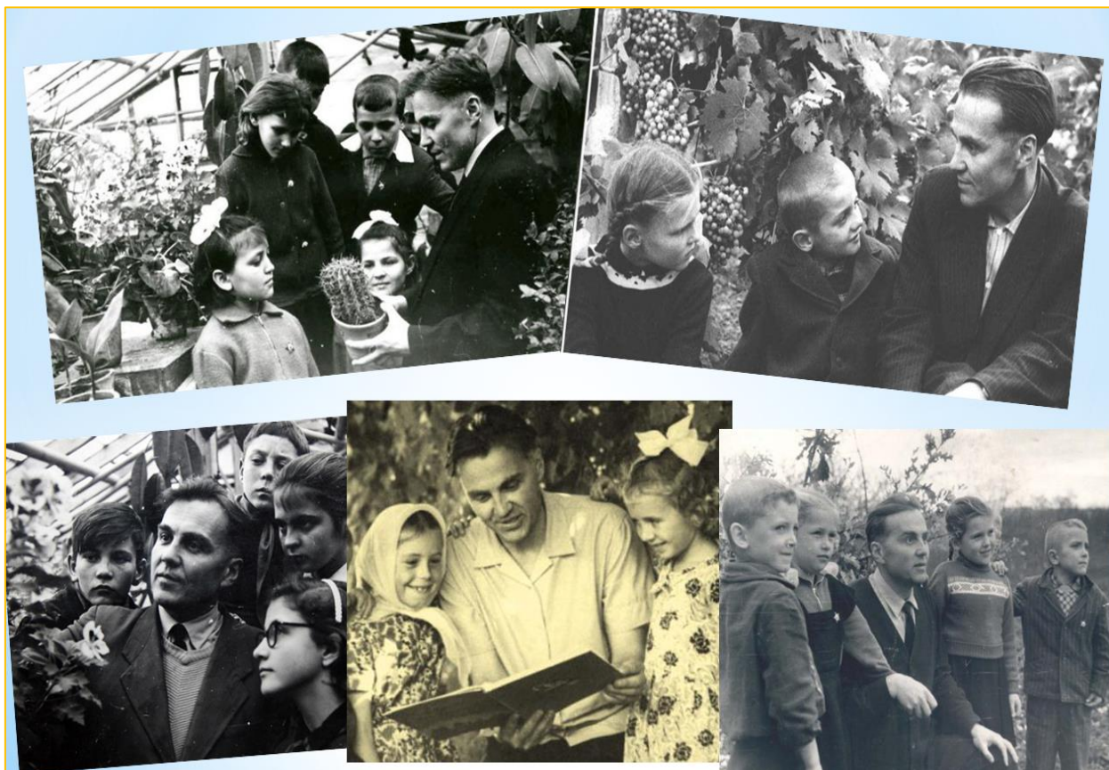
Фото 10. «Школа під блакитним небом» Василя Сухомлинського

Він назвав свою школу по-особливому – Школа під блакитним небом, або Школа радості (див. фото 10).