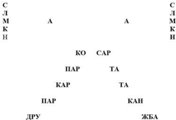
Рисунок 2. Променева таблиця

Під час вивчення букв на уроці також використовуються променеві таблиці (рис. 2).