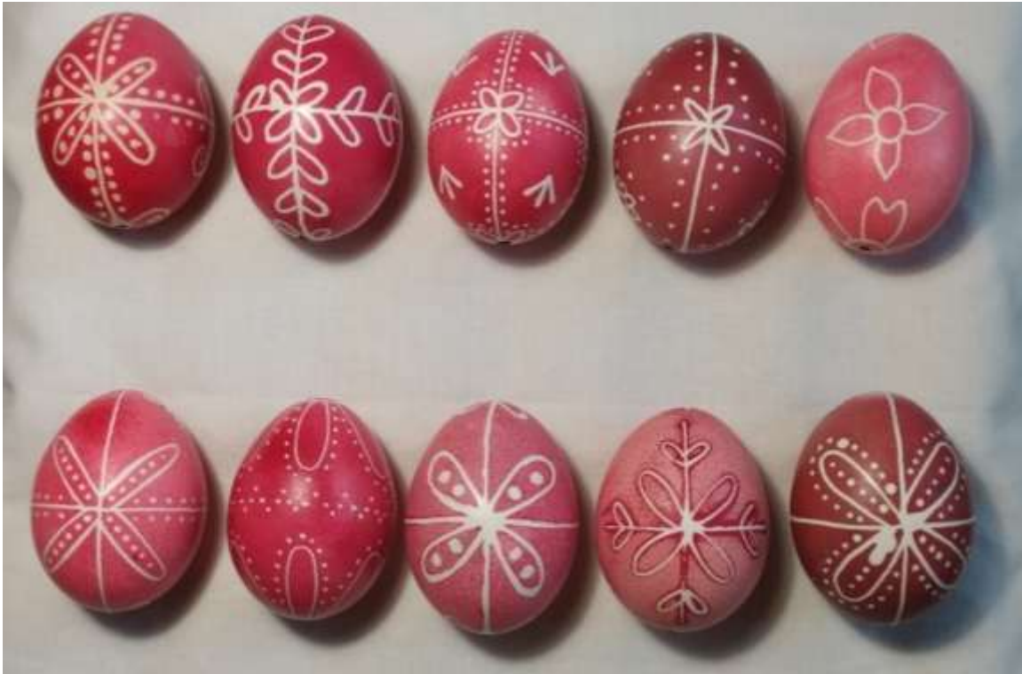
Рис. 1. Реконструкція писанок 20–30-х р. ХХ ст. долинян Закарпаття. Фонди ЗОКМ. Орнаментальні мотиви «Ружі». Відписав Пилип Р. І.