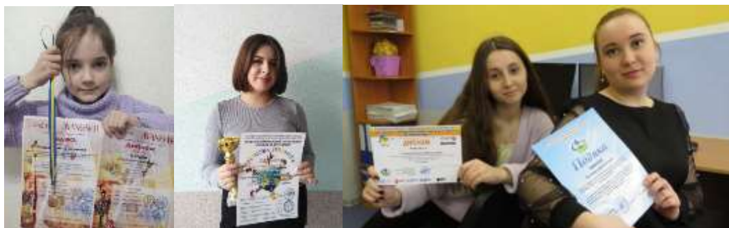
Рис.2,3,4. Результати роботи проактивного вчителя та його учениць

Професійна гнучкість. Якщо педагог прагне розвитку своєї кар'єри, то він обов'язково має адаптуватися до будь-яких професійних і особистих ситуацій. Наприклад, за останні роки роботи в Україні вчителям довелося адаптуватися до дистанційної та змішаної форм навчання. Це означає, що вчителям довелося навчитися використовувати нові засоби навчання, опанувати різні платформи для проведення уроків у режимі онлайн тощо. «Сильні» вчителі впоралися з цим завданням, яке з'явилося через карантинні обмеження та повномасштабне вторгнення росії в Україну. «Слабкі», на жаль, покинули свою роботу через відсутність цієї самої професійної гнучкості.