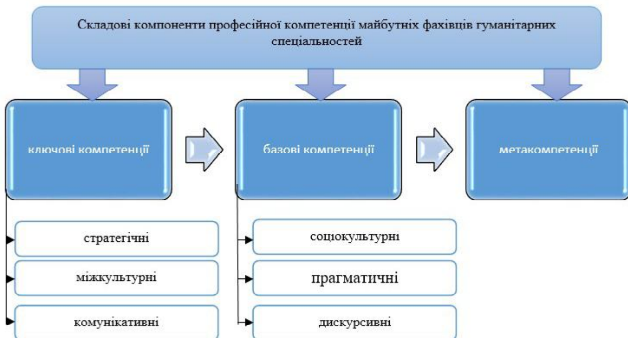
Рис. 3. Складові компоненти професійної компетенції майбутніх фахівців гуманітарних спеціальностей

відображає вміння та навички спілкування у цифровому середовищі, зокрема, спілкування у соціальних мережах, форумах і чатах, ведення ділової переписки, сприймання інформації у мультимедійному форматі.