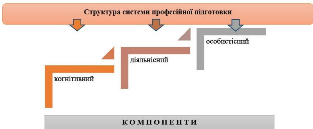
Рис. 1. Структура системи професійної підготовки

Сфокусуємо увагу на структурі системи професійної підготовки, яка у найбільш класичних варіаціях представлена когнітивним, діяльнісним і особистісним компонентами, взаємодія яких забезпечує якісну фахову підготовку здобувачів та формування в них готовності до реалізації професійної діяльності (Potapiuk, 2020). (див. рис. 1).