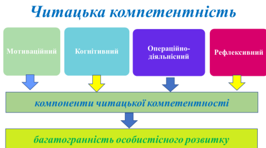
Рис. 1. Структура читацької компетентності

Читацька компетентність неможлива без мотиваційних потреб здобувачів освіти, когнітивного (знаннєвого), операційно-діяльнісного, рефлексивного складників. Чи не найважливіше значення має розвиток компонентів ціннісно-сислової та емоційно-вольової сфер особистості учня. Структуру читацької компетентності представлено на рис. 1.