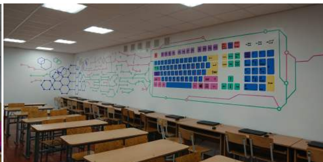
Фото 7. Кабінет початкових класів, ліцей № 9 м. Луцька