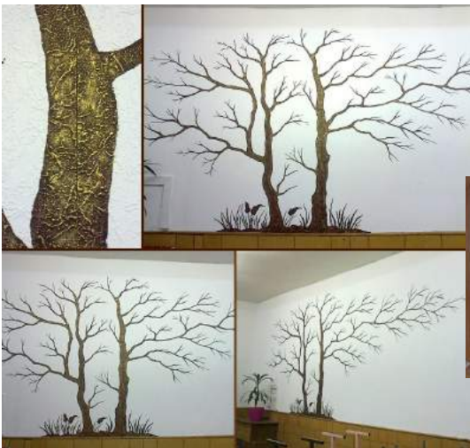
Фото 11. Розпис кабінету, лицей № 24 м. Луцька