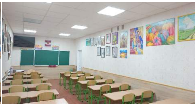
Фото 5–6. Кабінет образотворчого мистецтва, ліцей № 9 м. Луцька