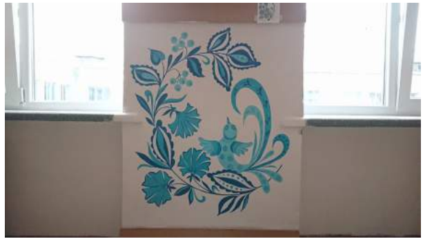
Фото 10. Рекреація, лицей № 9 м. Луцька