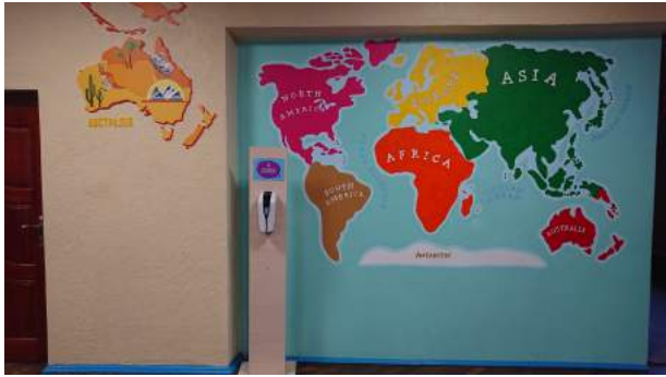
Фото 9. Коридор НУШ, ліцей № 9 м. Луцька