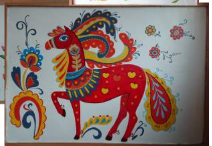
Фото 14–20. Настінний розпис