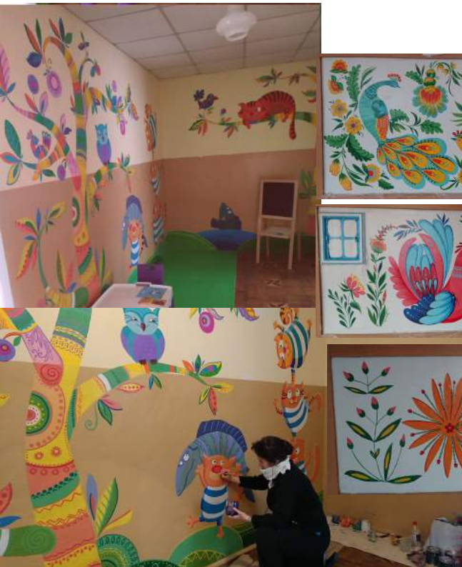
Фото 12–13. Розпис амбулаторії, с. Лище Луцького р-ну