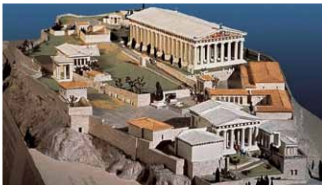
Використання 3D – сцен при вивченні теми "Архітектура давньої Греції"