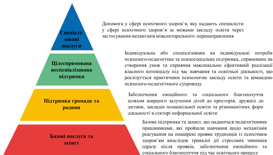
Багаторівнева модель інтеграції послуг з охорони психічного здоров'я