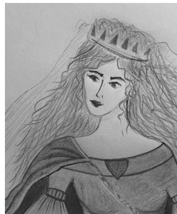
Рис. 4. Молода княгиня