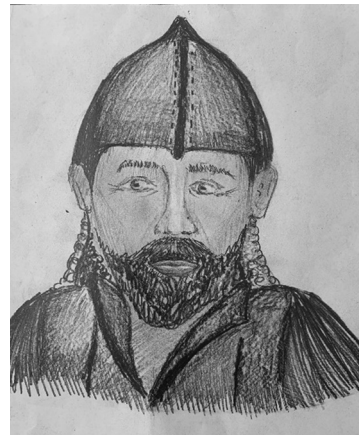
Рис. 3. Міндовг

У 6 класі на уроці образотворчого мистецтва з теми «Види портретів. Портрет у графіці» учні створюють на вибір портрет героя музичного твору Леонтовича «Дударик» або до літературного твору «Світязь» Адама Міцкевича, характеризуючи образ Дударика з хорової композиції М. Леонтовича та інших героїв, їхню любов до Батьківщини, героїзм в баладі А. Міцкевича «Світязь» [8].