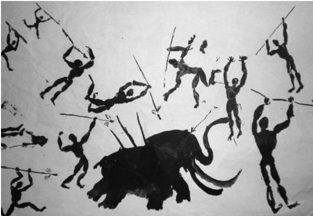
Рис. 2. Композиція із зображенням мисливців, які полюють на диких звірів. Інтерпретація наскельних малюнків перших людей

На уроках образотворчого мистецтва з теми «Лінійний, силуетний і тоновий рисунок» учні розповідають, що вони вже знають про побут, заняття, культуру первісної людини з уроків суспільствознавства інтегрованого курсу «Всесвіт», продовжують знайомитися з наскельними малюнками первісних людей, зазначають засоби виразності графіки, якими перші люди виконали наскельні малюнки, їхню тематику, переглядають відео про створення музеїв-копій печер з наскельними малюнками ( https://www.youtube.com/watch?v=mtliVNobKog ) та створюють композицію із зображенням мисливців, які полюють на диких звірів, використовуючи графічні засоби виразності та інтерпретуючи наскельні малюнки перших художників [6].