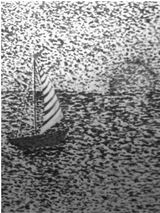
Рис. 5. Баркарола

У 7 класі (програма «Ліга крилатих») щотижня всі предмети об'єднує одна соціокультурна тема. Тож на уроці музичного мистецтва торкаємося загальної теми. Наприклад, соціокультурна тема «Європа» розкривається на всіх уроках – на уроці літератури учні читають твір Джона Бойна «Хлопчик у смугастій піжамі». На уроці історії опрацьовують тему «Культура бароко.