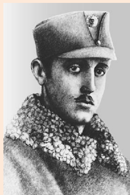
Василь Вишиваний. Енциклопедія історії України