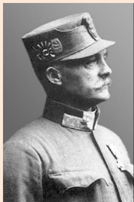
Мирон Тарнавський. Енциклопедія історії України

3-й доповідач. Мирон Тарнавський – український полководець. Народився у с. Барилів (нині Радохівський район Львівської області) в родині греко-католицького священника. Здобувши початкові знання у сільській народній школі, закінчив німецьку гімназію у Бродах та призваний на однорічну військову службу до австрійської армії. Навчався у старшинській школі у Львові, в офіцерській школі у Відні і отримав звання лейтенанта австро-угорської армії. Службу проходив у 18-му батальйоні крайової оборони у Перемишлі та інших гарнізонах Галичини. В 1909 р. здобув звання капітана, відбуваючи початкові бої Першої світової війни на австро-російському фронті. У травні 1915 р. після поранення і лікування прибув на фронт у Карпати й під час наступу австро-німецького війська зустрівся з вояками легіону. За його проханням у січні 1916 р. призначений командантом вишколу легіону УСС – навчальної частини, де впродовж кількох тижнів проходили військову підготовку стрільці і старшини перед відправкою на фронт. Частина перебувала у с. Розвадів на Львівщині. Під керівництвом М. Тарнавського старшини навчального підрозділу домагалися високої індивідуальної підготовки стрільців, а також підготовки та вишколу малих підрозділів – десятків і чот. У липні 1917 р. майор М. Тарнавський призначений командиром легіону УСС, але на початку 1918 р. відкликаний до австрійського війська, де брав участь у поході в Наддніпрянщину.