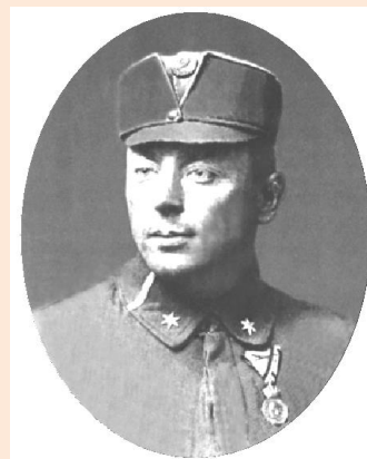
Петро Франко. Енциклопедія історії України

5-й доповідач. Петро Франко – відомий український педагог та письменник, військовик авіатор УГА. Народився у селі Нагуєвичі 28 червня 1890 року. Освіту здобував у Львівській академічній гімназії та Львівській політехніці, де вивчав хімію. У 1910 р. із братом Тарасом заснував у Львові відділ «Пласту». З 1913 року обоє вступили до організації «Січові стрільці». Коли розпочалася Перша світова, добровольцем записався до легіону Українських січових стрільців, де обіймав посаду сотенного командира. Написав ряд нарисів та художніх творів про січовиків. Особливо молодь любила читати твір «Від Стрипи до Дамаску. Пригоди чотаря УСС». Маючи диплом інженера та хист до техніки отримав направлення до авіаційної школи в місто Сараєво. Пройшовши відповідну підготовку, служив у авіачастині австрійської армії. Коли у Львові стався «Листопадовий зрив» та постала Західно-Українська Народна Республіка, Петро Франко створив повітряний флот Української Галицької армії.