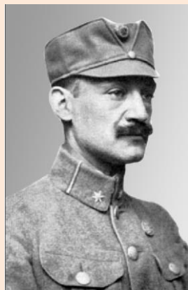
Володимир Старосольський. Енциклопедія історії України

Учні третьої групи презентують свої напрацювання, інші уважно слухають і записують тези повідомлень товаришів. Презентації демонструють на екрані.