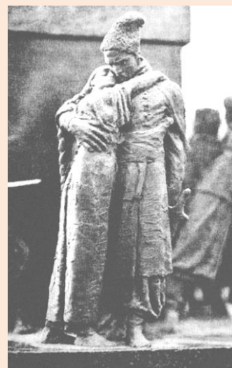
«Козак і дівчина». Скульптор Михайло Гаврилко. Фрагмент пам'ятника Тарасові Шевченку. Київ. 1913 р. Енциклопедія історії України

Цінними мистецькими пам'ятками доби стали твори стрілецьких малярів, серед яких багато портретів старшин та стрільців, картин зі стрілецького життя, графічних рисунків, карикатур, заставок тощо. Значну їх частину створено безпосередніми учасниками тих подій чи за інформацією очевидців. Тут відзначилися стрілець Осип Курилас, випускник Краківської академії мистецтв, який за короткий час створив дві сотні стрілецьких портретів, батальні картини «Маківка», «Битва на Лисоні» та інші; чотар Іван Іванець – картини «В поході», «Завія», «Допомога селу», «Стежа», «Вістовий» та інші; хорунжий Юліан Назарак, студент Краківської академії мистецтв, картини – «Бій під Семиківцями», «Барабанний огонь російської артилерії в Семиківцях». Поряд з ними творчо працювали стрільці Лев Гец – автор численних акварелей і рисунків та Осип Сорохтей – художник-ка-