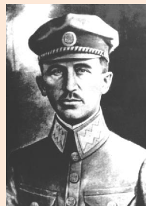
Осип Микитка. Енциклопедія історії України

Додаток № 7. Осип Микитка (* 21 лютого 1871 р., с. Заланів, Рогатинська міська громада, Івано-Франківська область – † 1920 р., м. Москва) – український військовий діяч, сотник УСС, генерал-майор (генерал-хорунжий) УГА. Народився в сім'ї народного учителя. Закінчив гімназію в місті Перемишль. Після закінчення кадетської школи у Відні (1902 р.) поступив на військову службу. Під час Першої світової війни служив кадровим офіцером австрійської армії – командиром роти та батальйону на Албанському фронті. Після формування легіону Українських січових стрільців був у ньому сотником, а 3 січня 1918 р. призначений командиром легіону, який із березня 1918 р. разом із австрійськими вояками (згідно з умовами Брестського миру 1918 р.) звільняв від більшовиків місто Одесу, Запоріжжя та Херсонщину. На цій посаді зустрів листопадові події 1918 р. Виступив проти переходу Української Галицької армії на бік більшовиків і прагнув здійснити евакуацію УГА з Одеси. Після провалу евакуації намагався вивести боєздатні частини армії до Румунії. Задля цього 15 січня 1920 р. видав наказ про відступ на південь. За ці дії 10 лютого 1920 р. заарештований і переданий командуванню Червоної армії. Перебував у підмосковному Кожухівському таборі для військовополонених галичан. Там йому пропонували обійняти керівництво дивізією Червоної армії. Відмовився. Вивезений до Москви, розстріляний.