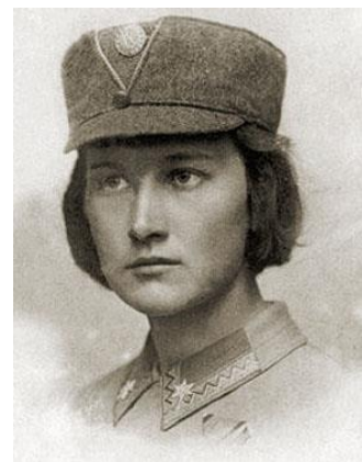
Олена Степанів. Вікіпедія

Учениця 3. Українська історикиня, географка, громадська і військова діячка, перша в світі жінка, офіційно зарахована на військову службу у званні офіцерки, пані лейтенант УГА Олена Степанів народилася 7 грудня 1892 року в селі Вишнівчик на Львівщині в родині священника Івана Степаніва. Мати – Марія-Мінодора, з родини Кунцевичів, – присвятила себе вихованню дітей: Оленки й Ананія. Син учився на юриста і загинув смертю хоробрих у лавах Української Галицької армії, а Оленка в дівочі роки стала живою легендою у боротьбі за визволення. Закінчила Першу дівочу школу імені Тараса Шевченка у Львові та семінарію Українського педагогічного товариства. Потім навчалася на історичному факультеті Львівського університету і одночасно «просувала» ідею участі жіноцтва у стрілецькому русі, брала участь у санітарних курсах і військових виправах, поглиблювала знання в наукових гуртках і вдосконалювала гру на фортепіано.