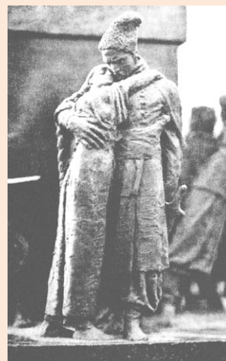
«Козак і дівчина». Скульптор Михайло Гаврилко. Фрагмент пам'ятника Тарасові Шевченку. Київ. 1913 р.