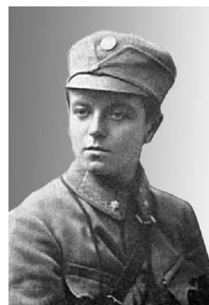
Софія Галечко. Енциклопедія історії України

Учениця 3. Софія Галечко народилася 3 травня 1891 року у місті Новий Сонч, що на Лемківщині (тепер Польща). В батьків – одиначка. У Новому Сончі закінчила народну школу, жіночу гімназію і вступила на філософський факультет університету міста Грац (Австрія). Вчилася на відмінно, багато читала. Брала активну участь у січовому стрілецькому рухові в Галичині. На початку Першої світової війни добровільно вступила до УСС. Із 1914 року воювала санітаркою, розвідницею, стрільчиною, чотаркою, хорунжою. В 1914–1915 рр. відзначилася у боях, зокрема на горі Маківка, за що її нагороджено Медаллю хоробрості. У 1917–1918 роках служила в запасній частині легіону. Долучилася до визвольних змагань 1917–1918 років.