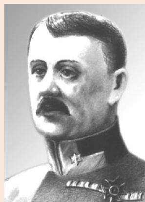
Антін Варивода. Енциклопедія історії України

Додаток № 3. Антін Варивода (* 10 січня 1869 р., м. Серет (Буковина) – † 12 березня 1936 р., м. Відень) – командант легіону Українських січових стрільців; полковник Української Галицької армії. Закінчив австрійську старшинську школу. З початку Першої світової війни очолював сотню в австрійському війську. З листопада 1916 р. по березень 1917 р. – командант УСС. Під час українсько-польської війни 1918–1919 рр. – полковник УГА. Призначений до складу ліквідаційної комісії, займався поверненням вояків-українців з Австрії та Італії на Батьківщину. У 1920 р. командував бригадою інтернованих вояків УГА в мм. Ліберець (Чехословаччина) та Яблонне (Німеччина). Проживав у Відні, де й помер.