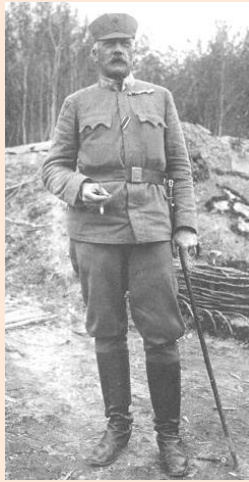
Франц Кікаль. Вікіпедія

Додаток № 4. Франц Кікаль (* ?, м. Брно, Моравія – † 1 липня 1917 р., с. Конюхи, Козівська селищна громада, Тернопільська область) – командант Українських січових стрільців (1917 р.). Під час Першої світової війни – підполковник австрійської армії. В 1914–1916 рр. служив у 24-му (Коломийському) піхотному полку австрійської армії, який майже на 80 % складався з українців. У листопаді 1916 р. переведений до УСС як командант вишколу Українських січових стрільців. Із 17 березня по 1 липня 1917 рр. – командант УСС. Був єдиним командантом-іноземцем у легіоні. Франц Кікаль загинув у ході боїв легіону з російськими військами.