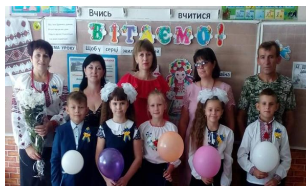
Батьківські збори: поради щодо організації навчання. 3 клас