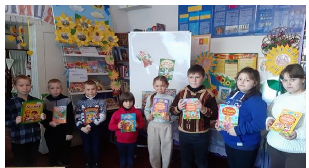
Відвідини бібліотеки ліцею «Читати модно!»