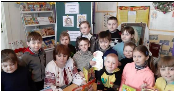
Урок-зустріч у літературній кав'ярні «Тарас Шевченко – сонце України», 3 клас