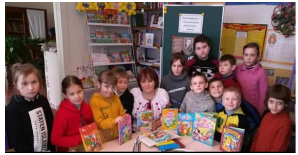
Урок-кейс «Літературні казки», 4 клас