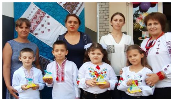
Батьківські збори з елементами тренінгу «Для Всезнаюк». 2 клас