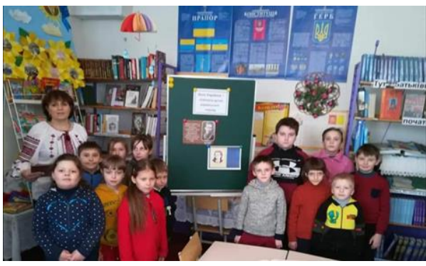
Урок- мандрівка «На шлях я вийшла ранньою весною» (Л. Українка), 3 клас