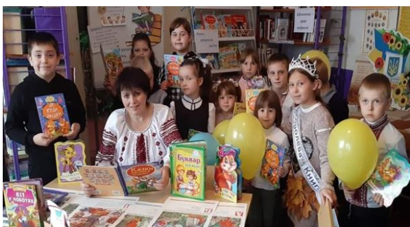
Урок – гра «Літературний турнір», 3 клас