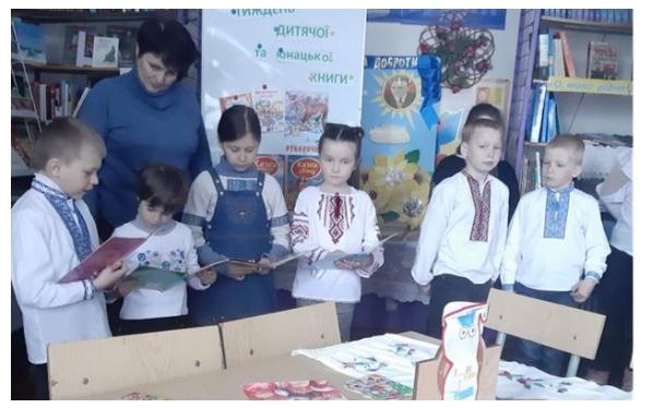
Урок-фантазія «Фарби Осені»