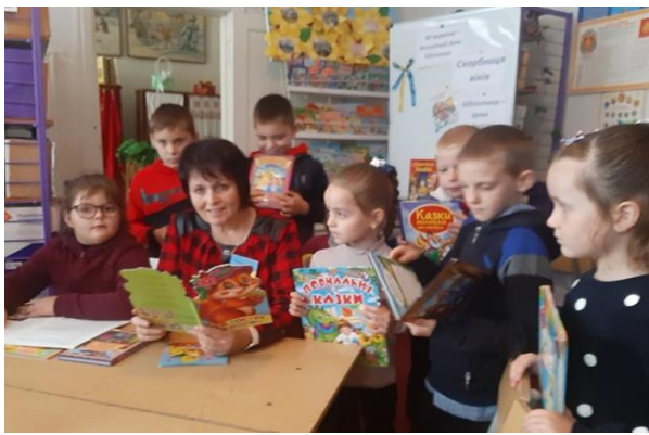
Бібліотечний урок «Сторінками улюблених казок»