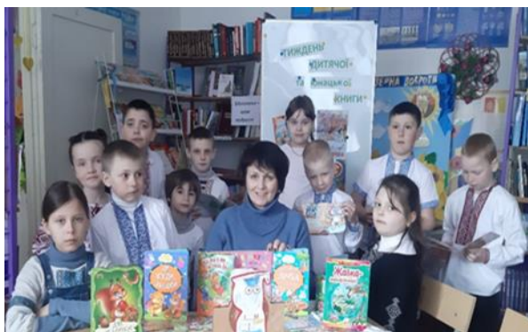
Урок позакласного читання «Нескорені»

Учень – це не посудина, яку треба заповнити, це смолоскип, який треба запалити.