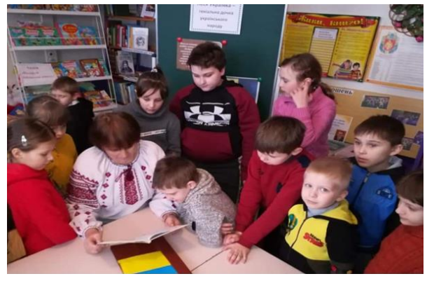
Урок-казка «Зимові фантазії»