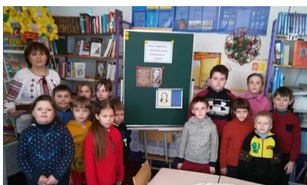
Під час нестандартного уроку позакласного читання з теми «Леся Українка дітям», 4 клас