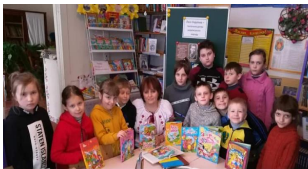
Урок-подорож «Книги, що все знають»