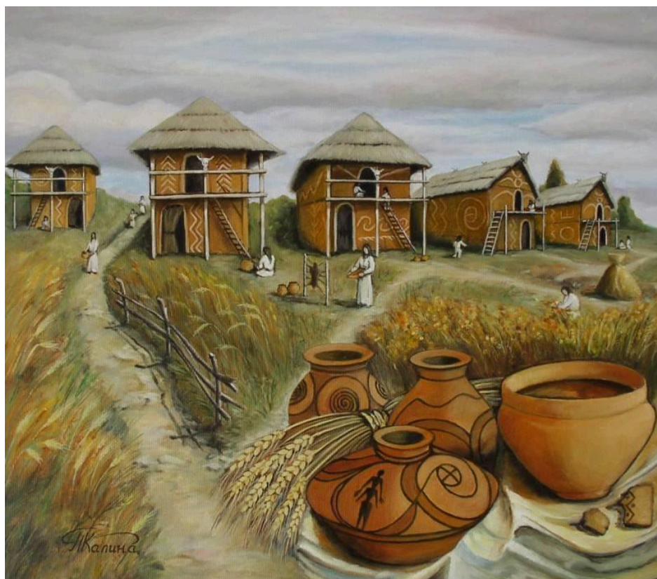
Реконструкція трипільського поселення

Трипільська та середньостоговська археологічні культури. Найвідомішою культурою на території України є трипільська культура, розселення племен якої відноситься до IV – середини III тис. до н. е.). Назва походить від с. Трипілля на Київщині, поблизу якого наприкінці XIX ст. визначний археолог Вікентій Хвойка виявив сліди діяльності давніх землеробів, які свідчать про високий рівень розвитку відтворювального господарства.