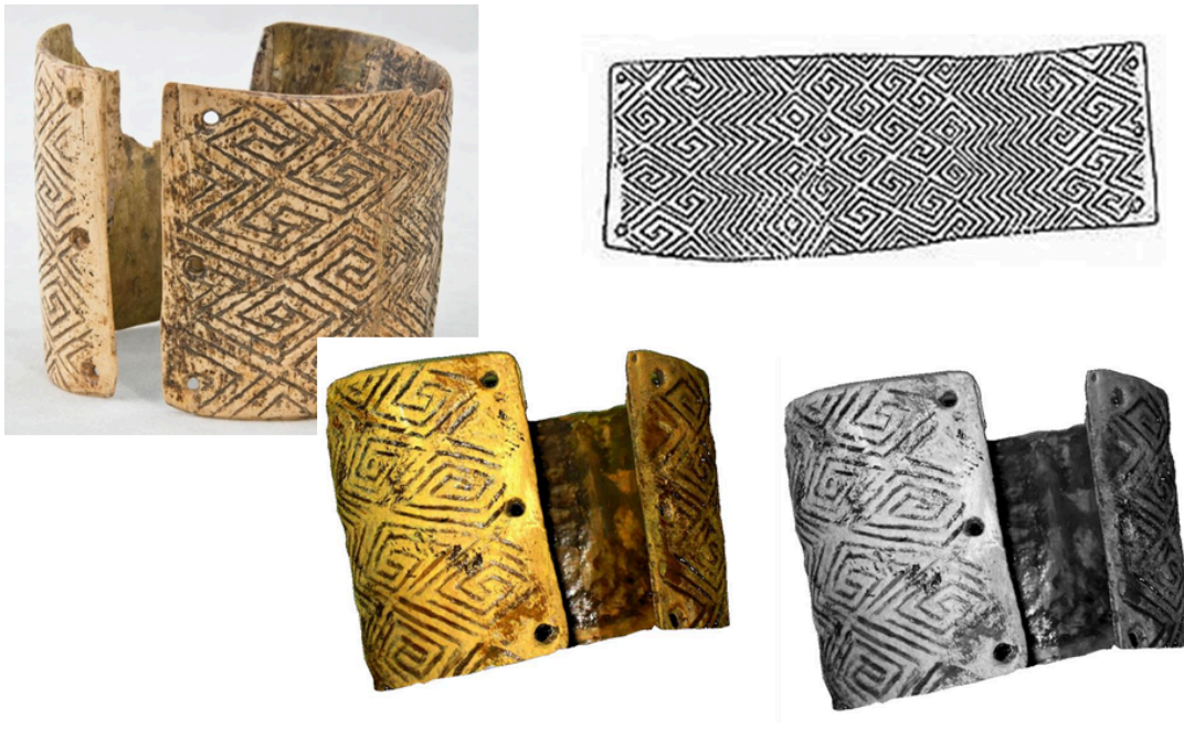
Браслет з меандровим орнаментом. Мізин

Залюднення території України відбувалося через Балкани та Центральну Європу, деякі вчені вважають, що і через Кавказ.