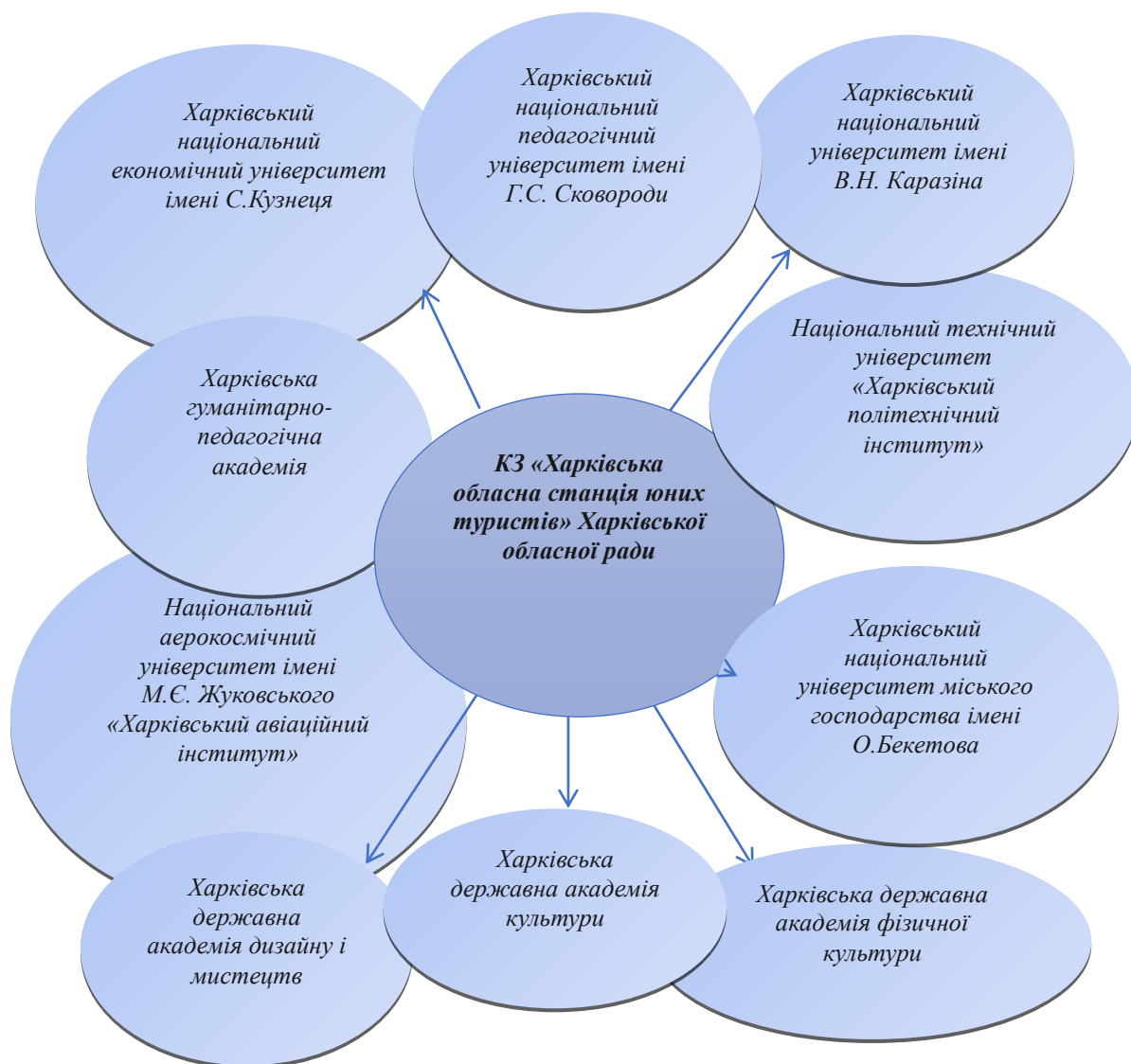
Рис. 2. Співпраця КЗ «Харківська обласна станція юних туристів» Харківської обласної ради із закладами вищої освіти м. Харкова

КЗ «Харківська обласна станція юних туристів» практично єдиний заклад позашкільної освіти в Україні, який протягом багатьох років опікується дитячим геологічним рухом. Десятки геологічних гуртків, щорічна олімпіада юних геологів Харківщини, турнір юних мінералогів, геологічні експедиції – це неповний перелік заходів, які залучають учнівську молодь до вивчення надр Землі, зокрема України та Харківської області.