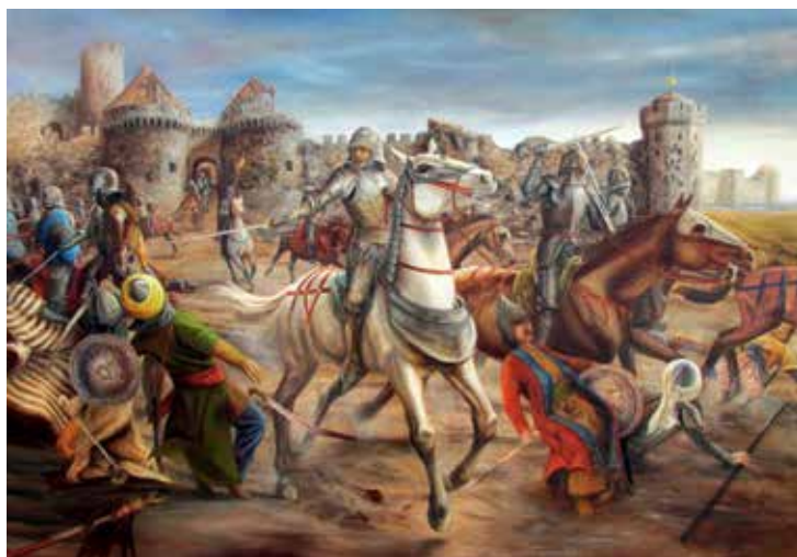
A nándorfehérvári csata

Ekkor történt, hogy egy torony védelmében az egyik vitéz, Dugovics Titusz birokra kelt egy törökkel, aki zászlóját ki akarta tüzni a bástyára. Amikor látta, hogy kifáradt erejével nem bírja a törököt legyőzni, átnyalábolta ellenfelét, és a mélybe vetette magát.