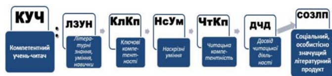
Рис. 4. Компетентнісно-діяльнісна парадигма в системі літературної освіти учнів-читачів

Основа моделі — компетентнісно-діяльнісна парадигма, що не заперечує знання, уміння й навички, але, обмежуючись лише цим, «провокує» учня / ученицю бути пасивним об'єктом. Тому для нас важливо зважити на теорію діяльності А. Леонтьєва, яка забезпечить перетворення школяра на активного суб'єкта співпраці в процесі літературної, читацької діяльності. Відповідно слід зробити доповнення. За умов упровадження компетентнісно-діяльнісного підходу традиційна тріада має бути доповнена новими дидактичними одиницями: