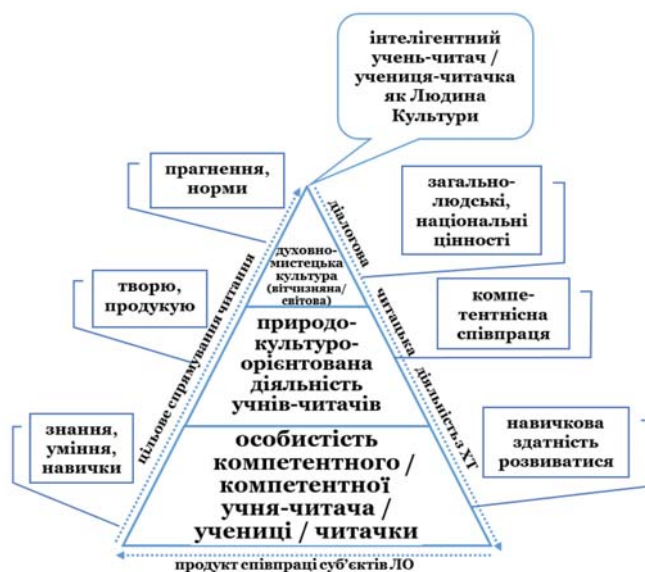
Рис. 1. Модель «Літературна компетентність» і складники вибудови літературної освіти випускника-читача (ЛСМ-1)

Отже, літературна компетентність — стала якість літературної освіти особистості-читача, що забезпечує нерозривну єдність її літературної спрямованості і літературного досвіду в системі духовно-мистецької, літературної, читацької діяльності.