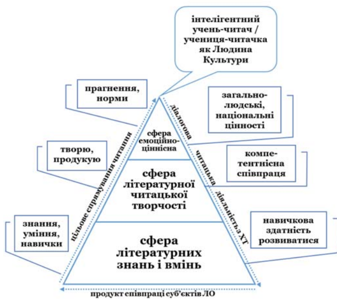
Рис. 2. Складники суб'єктивного духовно-мистецького досвіду інтелігентного (компетентного) випускника-читача

З огляду на це особливою перспективністю й евристичністю вирізняється метод проєктів, що в системі літературної освіти покликаний зорієнтувати учня-читача на самостійну діяльність із літературним (мистецьким) твором, органічно поєднується з груповим підходом до навчання й учіння і спрямований на розв'язання літературно-мистецької проблеми засобами художнього твору. Також цей метод забезпечує суб'єктну позицію учня-проектанта-читача під час осягнення тканини художнього твору, спроможність висловити свою авторську позицію, вступити в діалог, полілог із автором, літературним персонажем, колегою учнем-читачем, соціумом, вітчизняною та світовою культурою тощо. У кінцевому результаті такий підхід сприятиме вибудові та реалізації власної траєкторії літературних досягнень випускника-читача, які можуть матеріалізуватися в літературне портфоліо учня-читача / учениці-читачки як накопичувальний засіб видів робіт.