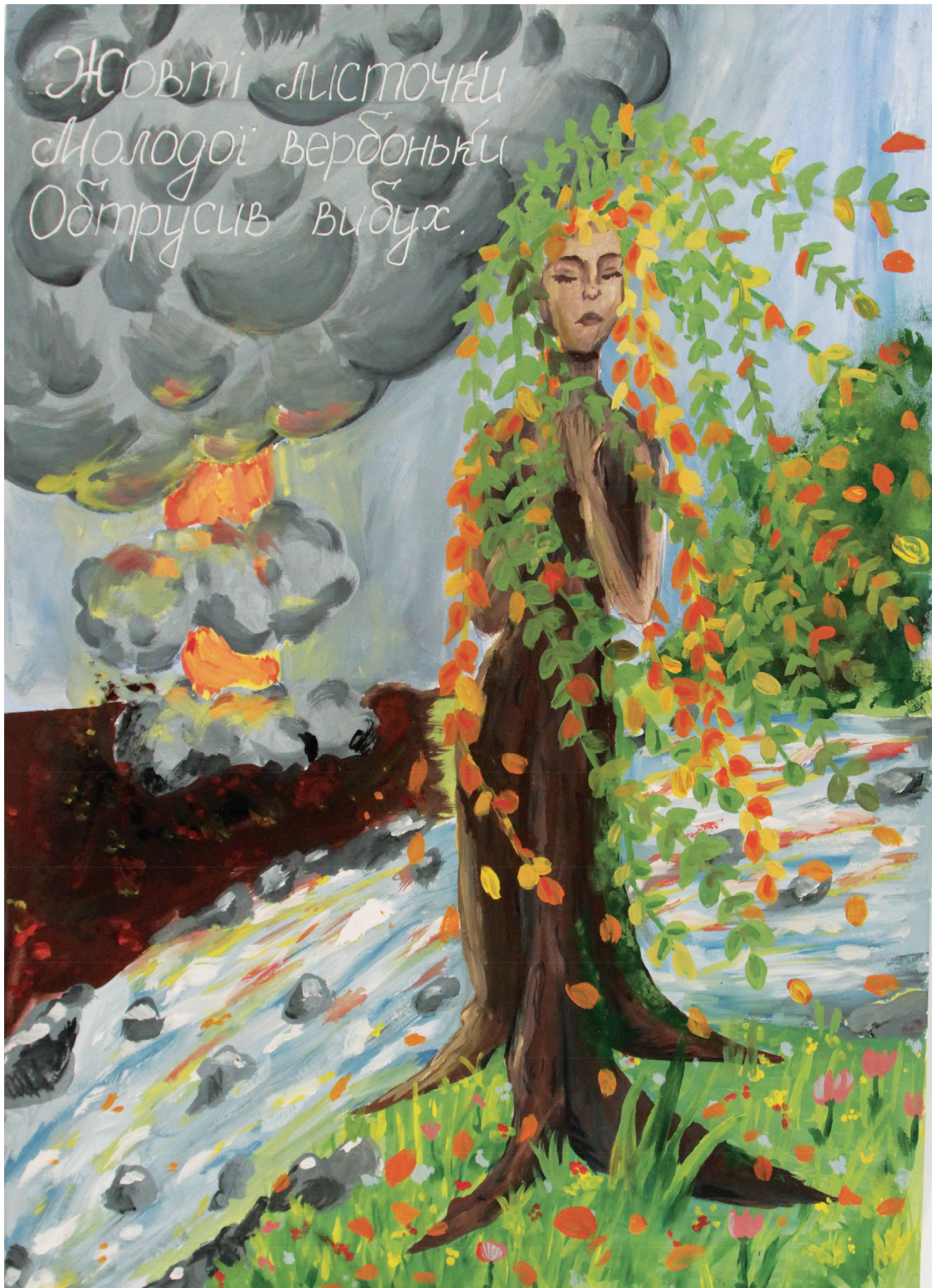
Малюнок і хайку Софії Назарчук (13 років). Одеський ліцей № 63. м. Одеса