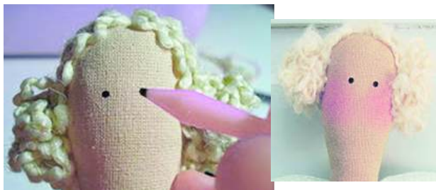
Рисунки 3, 4

Обличчя ляльки в стилі тильда складається лише з двох очей-крапочок і рум'ян. Це економить матеріали, не потребує складної косметики, фарб, великих наборів, робить іграшку «теплою» та універсальною. На лиці у тильди завжди є рум'янець, його можна нанести звичайною косметикою (рис. 3, 4).