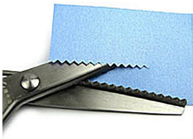
Рисунки 15, 16

Окремої уваги заслуговує виготовлення тильди у стилі Zero Waste , що передбачає повністю безвідходний підхід. Тильда у цьому стилі – це сучасний напрям, у межах якого іграшки створюються виключно з матеріалів, що вже перебували у використанні: зношеного одягу, тканинних обрізків та дрібних залишків, які зазвичай утилізуються. Такий виріб слугує не лише результатом творчої діяльності, а й наочним прикладом екологічного мислення, раціонального