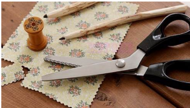
Рисунки 17, 18

використання ресурсів і відповідального споживання.