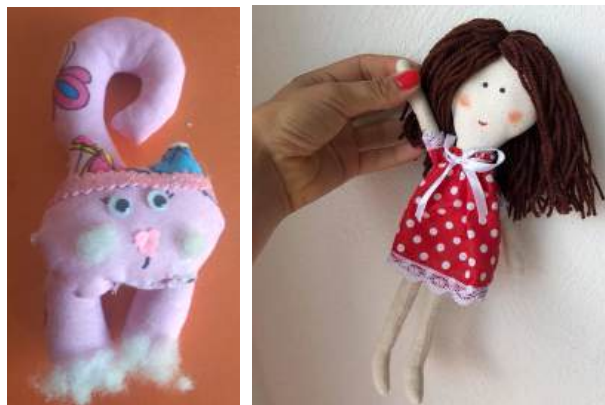
Рисунки 1, 2