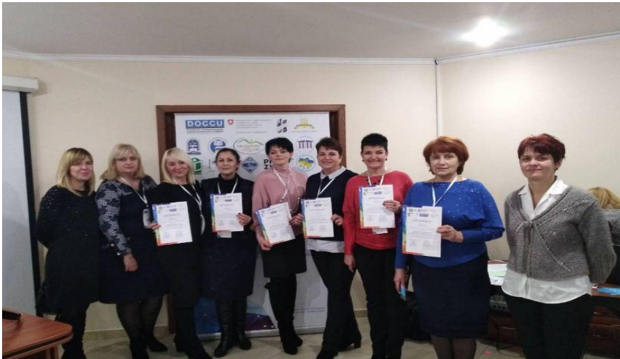
DOCCU – освіта для демократичного громадянства