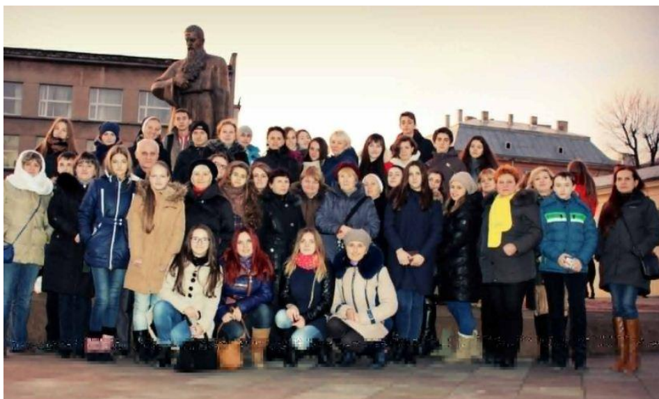
Переможці загальноміського конкурсу «Андрей Шептицький – видатний державний діяч» у м.Львові