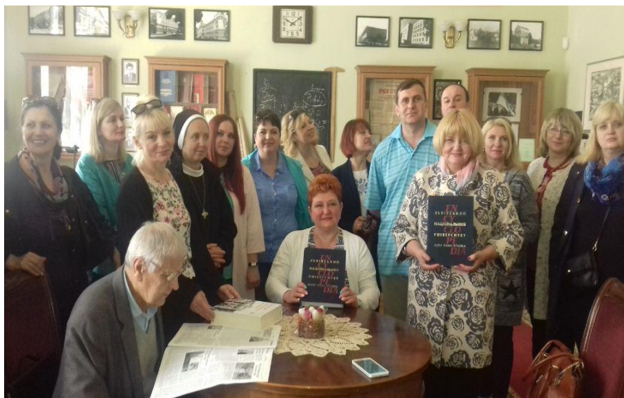
Виїзний семінар на базі Львівського державного національного університету ім.І.Франка