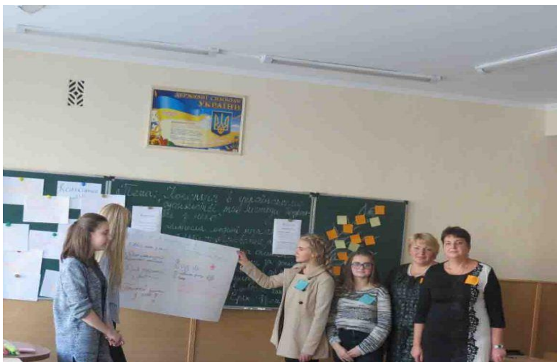
Тренінг для депутатів РУС «Разом проти корупції»