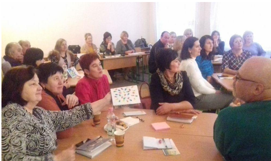
Впровадження авторської технології Л.Павленко «Хрестики-нулики»