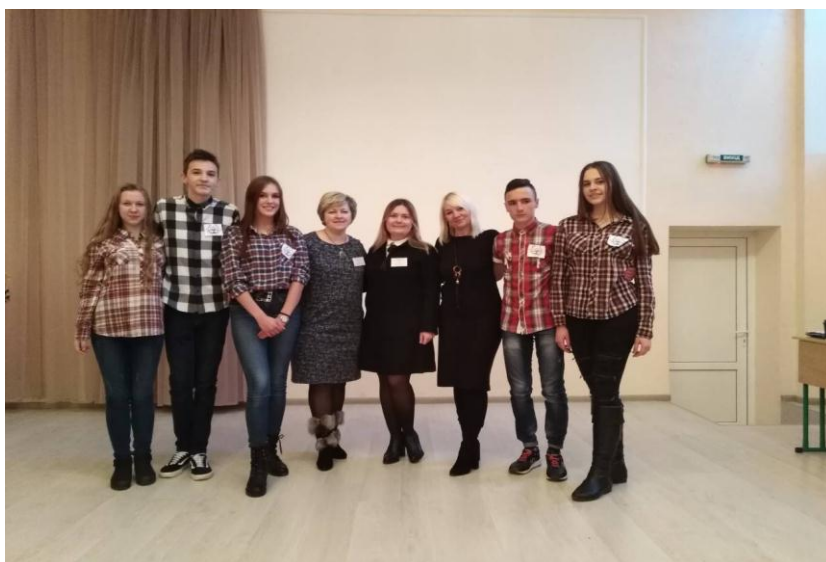
Юридичний брейн-ринг на базі Юридичного інституту Прикарпатського національного університету ім. Василя Стефаника