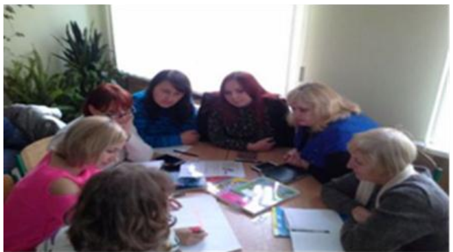
Тренінг вчителів суспільних дисциплін на базі ЗШ № 4