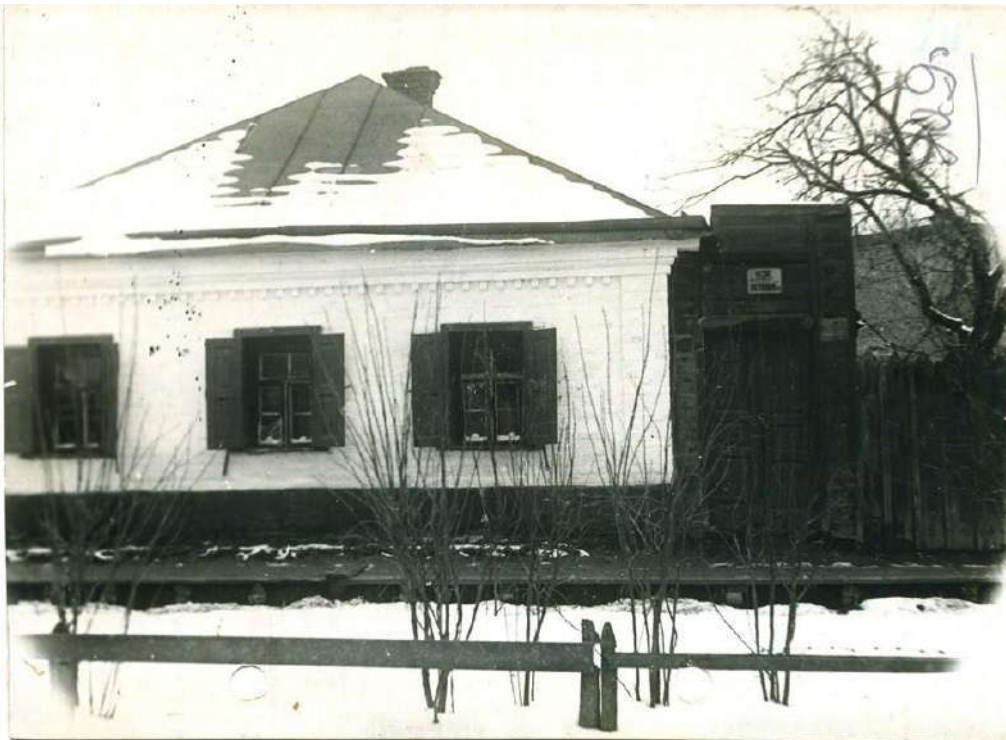
Будинок родини Симона Петлюри (вигляд з вулиці). 1937 рік