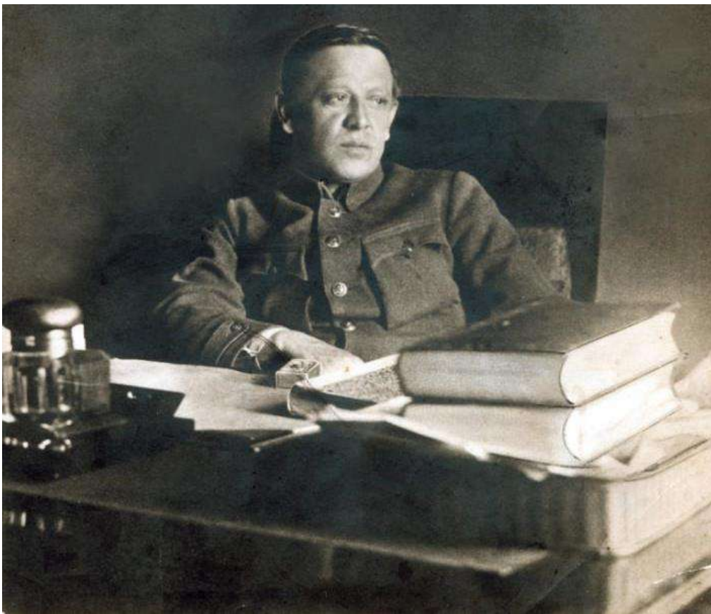
Одне із останніх фото Симона Петлюри. 1925 рік