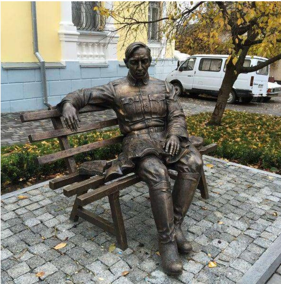
Пам'ятник Симону Петлюрі