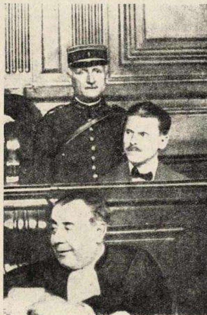
Шварцбард на скамье подсудимых, впереди Торрès.

— Я спрашивал всех своих знакомых, где же точно находится Петлюра. С каким невыразимым презрением все мне отвечали, что не хотят даже произносить имя этого человека. Однажды мне попала в руки его фотография, я ее захватил с собой и стал носить при себе револьвер. Но я хотел быть уверенным, что пуля попадет именно тому, в кого она предназначена. 25 мая 1926 г. я встретил убийцу... Когда я увидел, что он выходит из ресторана на улице Расина, я посмотрел ему в лицо и крикнул: „Пан Петлюра!“