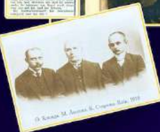
Симон Петлюра, Голова Директорії Головного отаман військ і флоту УНР, ініціатор створення Української Республіканської Капели Фотодокумент віртуального музею УНР

Фотовиставка “Культурна дипломатія України: світовий тріумф Щедрика” – про неймовірний резонанс світового турне Української Республіканської Капели. У добу Української революції, коли небувалого розмаху набув хоровий рух, голова Директорії УНР Симон Петлюра задумав популяризувати Україну за кордоном за допомогою пісні. В січні 1919 року він доручив диригентам Олександрові Кошицю та Кирилові Стеценку організувати колектив і вирушити у турне. Чому саме Кошицю? Бо вони приятелювали ще з часів учителювання на Кубані. Гастролі принесли славу як Кошицю, так і українській пісні, а різдвяний “Щедрик” Миколи Леонтовича став улюбленим у багатьох країнах Європи та Америки. Репертуар Української республіканської капели складався виключно із народних пісень в обробці Миколи Лисенка, Кирила Стеценка, Олександра Кошиця, Миколи Леонтовича.