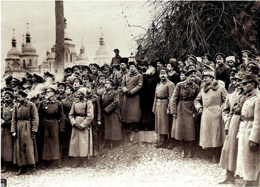
Мітинг з нагоди відкриття III Всеукраїнського військового з'їзду (в центрі – Симон Петлюра, Михайло Грушевський та Володимир Винниченко). Листопад 1917 року