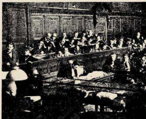
Суд над Шварцбардом.