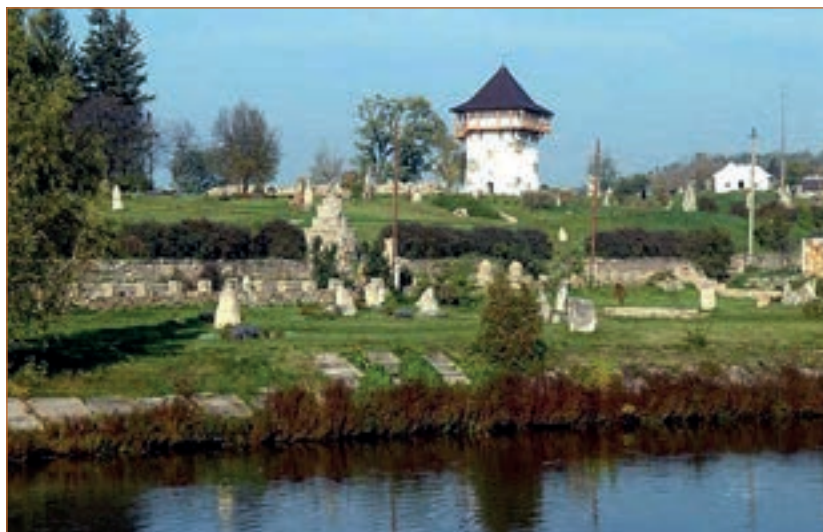
Буша. Загальний вигляд заповідника. Фото

На південь від Могильова, за двоє гін від Дністра, на високій скелі лівого бережжя притулилось містечко Буша з тверджею-замком, що панував над околицею. На вузькім стрімчаку, немов орлине гніздо, повис отой замок і на синьому небові далеко білів своїми зубчатими мурами, своїми бійницями-баштами. Край п'яти тієї скелі розсипались, мов курчата круг квочки, манесенькі селянські й міщанські хатки, окутані вітами зелених садочків; між критими соломою стріхами здіймались де-не-де й високі черепичні дахи, що червоніли між яриною здалеку. Саме місто Буша, — цебто торговий майдан, — з одного боку тулилось до стрімчастої скелі, а зокола було обмежане високим земля-