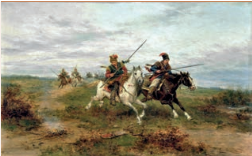
Л. Гедлик. Козаки. Приступ.

На сході вже починав ясніти край неба, коли сотник, обійшовши пригород, запримітив на самому ближчому майданчику, сажнів за триста, не більше, якийсь вал, на середині котрого видно було ясніші крапки; не встиг сотник гарненько розглядіти ці будови, як усі ці крапки разом сяйнули блискавками і за хвилю розляглись страшним грюкотом, що приніс у табір спустошення (М. Старицький).