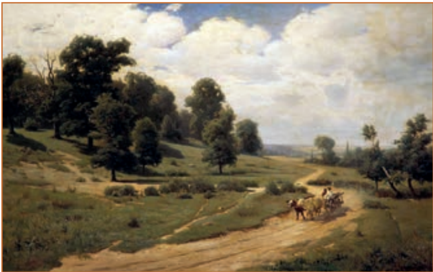
С. Васильківський. Український пейзаж.

Ось ранок, ясний та погожий ранок після короткої ночі. Зірочки кудись зникли — пурну́ли у синю безодню блакитного неба; край його горить-палає рожевим огнем; черво́нуваті хвилі ясного світу миготять серед темноти; понад степом віє її останнє зітхання; положисті балки дримають серед темної тіні, а високі могили виблискують срібною росою; піднімається сизий туман і легесеньким димком, чіпляючись за рослину, стелється по землі. Тихо, ніщо не шперхне, ніщо не писне... ( Панас Мирний ).