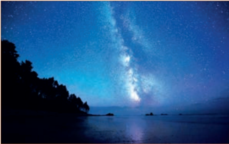
Зоряне небо. Фото.

Свїтловий потїк деяких типів зїр то посилюється, то послаблюється; одночасно з цим змінюються їхні розміри. Так званї новї зорї інколи раптово спалахують, потїк їхнього випромїнювання збільшується в десятки тисяч разів, в усїх напрямках вивергаються хмари газоподїбної речовини, якї рухаються із швидкїстю до 1000 км/с. Пїсля таких спалахів зорї повільно повертаються до нормального стану (“Астрономїя”).