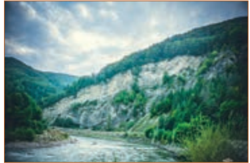
Річка Черемош. Фото.

I. 1. Кучерявий Черемош сердито поблискував сивиною і світивсь по-під скелі недобрим зеленим вогнем. 2. В тихих місцях Черемош як ситий віл, а там, де йому твердо лежати, він скаче скажено з каміння на камінь. 3. Піниста сваволя потоків. 4. Кипів холодний Черемош. 5. Синє дихання чорних лісів. 6. Гори вікують у такій тиші, що чують навіть дихання худоби. 7. Царинки блищали, як дзеркала в чорних рамах смerek. 8. Чорні смereки спускають сум свій в Черемош, а він несе його долом й оповідає. 9. Зажурені гори вкрила сумна смereка. Їх поять сумом тіні од хмар, що все стирають біду усмішку царинок.