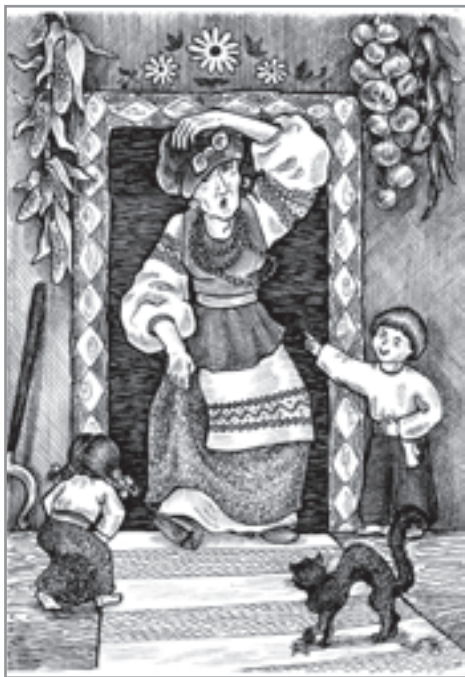
I. Нечуй-Левицький. "Кайдашева сім'я". Худ. I. Васалига.

З других букв виписаних слів складеться: 1) слово, пропущене у вислові Л. Костенко: "... відкрити важче, ніж Америку "; 2) друга частина слова, недописана у вислові А.-Е. Брема: " Головний ворог кохання — бай... ".