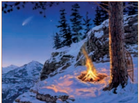
Вихідні в горах. Фото.

II. Дайте відповіді на питання. Обґрунтуйте їх.