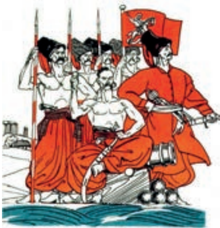
І. Котляревський. “Енеїда”. Худ. А. Базилевич, 1967.

1. Був собі одважний лицар, нам його згадать до речі, він робив походи довгі, — від порога та до печі ( Леся Українка ). 2. А чого ж, це ідея, юні помічники були б нам якраз до речі ( О. Гончар ). 3. Маруся зрозуміла, що сказала щось не до речі ( Г. Хоткевич ). 4. Воно трохи і не до речі, просить мов той старець ( Т. Шевченко ). 5. До речі, про берези ще дещо пригадав я ( М. Рильський ).