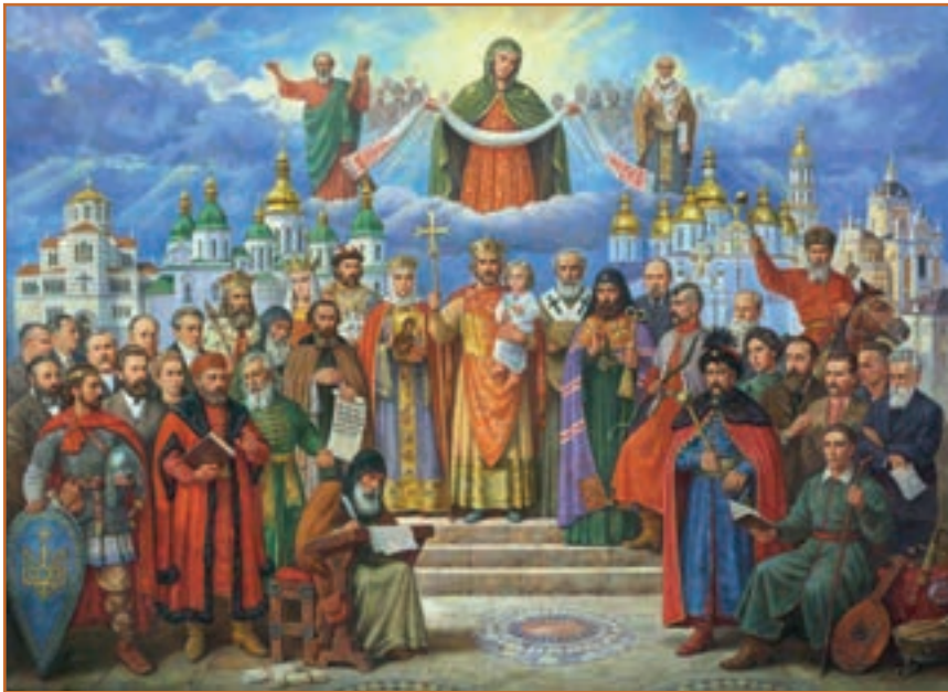
А. Орлюнов. Україна славетна (Хрещення України-Русі).

Якби вся Україна опинилася під Росією, вона б давно уже загинула, зде-націоналізована валуєвими, столипіними, сталініми, брежнєвими і, зрештою, горбачовими: її задушила б русифікацією і фізичним мором Московія. Бог залишив частину України — Галичину — в легшій, австрійській і польській неволі, де панувала скупа, а все ж таки елементарна демократія, і в ній мали можливість вирости духовні й політичні провідці... (Р. Іваничук).