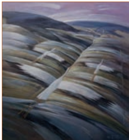
О. Шупляк. До рідних осель.

II. Підготуйтеся до усного переказу тексту: поділіть текст на смислові частини, складіть план розповіді, запам'ятайте окремі висловлювання.