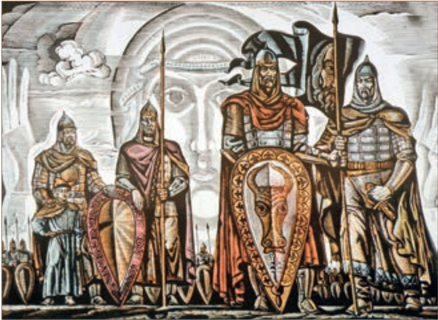
“Слово о полку Ігоревім”. Худ. В. Лопата, 1986 р.

пильній дорозі не з'явиться її дорогий ладо зі своєю дружиною. Але порожньо на дорозі, не повертається князь Ігор з походу.