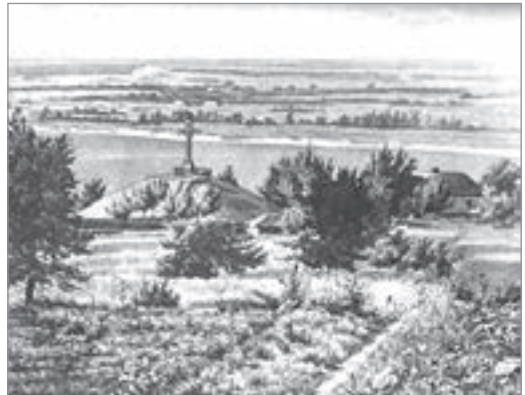
Могила Тараса Шевченка в Каневі. Кін. XIX ст. Гравюра з журналу "Киевская старина".

Підходимо до передніх бабусь, а вони, знаючи наш намір, почали навперей пропонувати свої букети. Квіти в них у руках і у відрах із водою були дуже