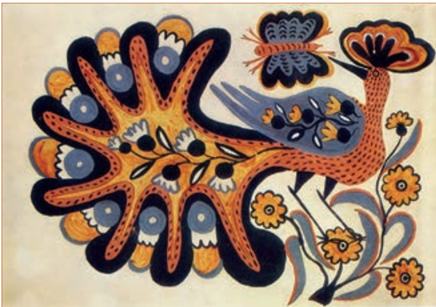
М. Приймаченко. Казкова-птиця — павич, 1936 р.

А чому б у таких діоптріях не подивитись на Україну? Якщо десь у світі чують — Україна, українці, які це асоціації викликає там? Хіба це не правомірне запитання? Ми вже держава. То чи не час замислитись, хто ми в очах світу і яку маємо ауру, а якщо не маємо, то чому? (Л. Костенко).