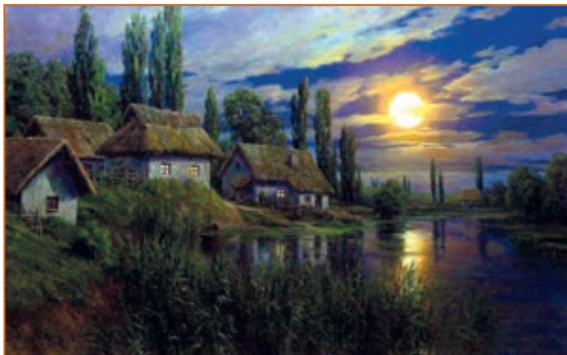
А. Огурцов. «Місяць уповні».

усі живі істоти, як і наша земля; кожна з них живе своїм життям, тягнеться до своєї подруги, от як і наша земля до сонця. І всім їм місце є в тому безмірному краї. Якою ж величезною повинна бути та обшир, що їх у собі розмістила? Чим ти виміриш ту безмірну пустиню, що зветься світом? І думкою не збагнеш тієї без кінця-краю озії!.. (Панас Мирний).