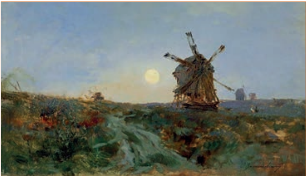
С. Васильківський. Млини.