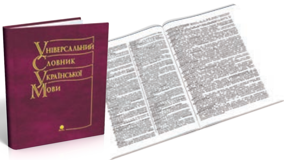
3. Куньч. Універсальний словник української мови.

робота над Оксфордським словником англійської мови — 52 роки. В. Даль, який нібито “сам” уклав знаменитий “Толковый словарь”, мав цілу мережу кореспондентів — і присвятив тому словникові 53 роки, тобто все своє свідоме життя. Редагування українсько-російського словника, яке здійснив Б. Грінченко, з повним правом ми можемо назвати гідним глибокої пошани трудом талановитого й працьовитого лексикографа. Але ж не треба забувати, що матеріали для словника, який ми звикли титулувати Грінченковим, збиралися протягом майже 60 років ( М. Рильський ).