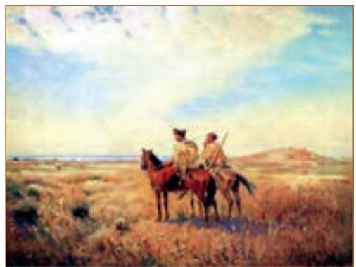
С. Васильківський. Козаки в степу. 1890 р.

1. В Січі довкола великого майдану розташувалися курені, побудовані всі на один копил (Петро Панч). 2. — Всі зібрані? — Тут. — Кроком руш! (Григорій Тютюнник). 3. Він і роботи не боїться. І взагалі... смілива, хвацька душа. 4. Холодне циганське сонце світило тепер уже їм десь із-за потилиці (з тв. О. Гончара). 5. — Чи гаразд у них у господі? — Де там! Такі стали голі, як турецькі святі (Марко Вовчок).