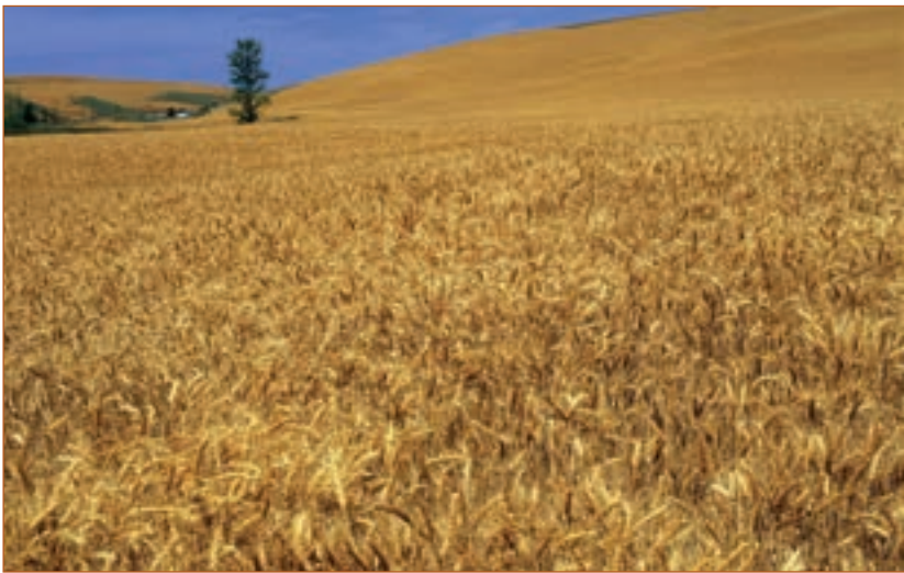
Ячмінь у полі. Фото.

На небі сонце — серед нив я. Більше нікого. Йду. Гладжу рукою соболину шерсть ячменів, шовк колосистої хвилі. Вітер набива мені вуха шматками згуків, покошланим шумом. Такий він гарячий, такий нетерплячий, що аж киплять від нього срібноволосі вівса. Йду далі — киплять. Тихо пливе блакитними річками льон. Так тихо, спокійно в зелених берегах, що хочеться сісти на човен й поплисти. А там ячмінь хилиться й тче... тче з тонких вусів зелений серпанок. Йду далі. Все тче. Хвилює серпанок. Стежки зміяться глибоко в житі, їх око не бачить, сама ловить нога. Волóшки дивляться в небо. Вони хотіли бути як небо і стали як небо (М. Коцюбинський).