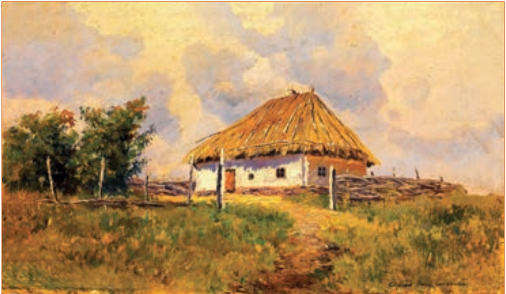
С. Васильківський. Українська хата на пагорбі.

Хатиночка як чашечка: невеличка, чиста, ясна, весела. На покуті стояли образи в срібних шатах, завітчані васильками, гвоздиками, безсмертниками; перед образами на срібному ретязьку висіла срібна лампадка. У тому ж таки кутку — стіл столярної роботи; у другому — ліжко, заслане м'яким шовковим коцом; попід стіною невеличкі стільці. Всюди так хороше, чисто; пахощі од васильків та м'яти окривали всю хату, лоскотали чуття. Чіпці здалося, що він у рай вступив... ( Панас Мирний ).