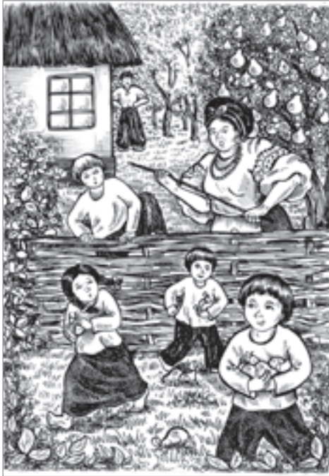
І. Нечуй-Левицький. “Кайдашева сім’я”. Худ. І. Басалига.

неначе якась золота вода крутилась поміж людьми, неначе якась основа з тонких золотих ниточок снувалась по двору кругом людей, кругом хат, навкруги садка. Собаки стояли коло хат і крутили хвостами, дивлячись на людей, їм здавалося, що їх от-от покличуть і нацькують ними когось (І. Нечуй-Левицький).