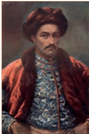
О. Курилас. Іван Мазепа.

Обидва вони, через свавільство своє і привласнення необмеженої влади, подобляться найстрашнішим деспотам, яких вся Азія і Африка навряд чи коли спороджувала. І тому подоланий з них і повалений зруйнує собою державу свою і оберне її нанівець. Жереб держав тих визначила наперед доля рішиться в нашій отчизні і на очах наших, і нам, бачивши загрозу тую, що зібралася над головами нашими, як не помислити і не подумати про себе самих?