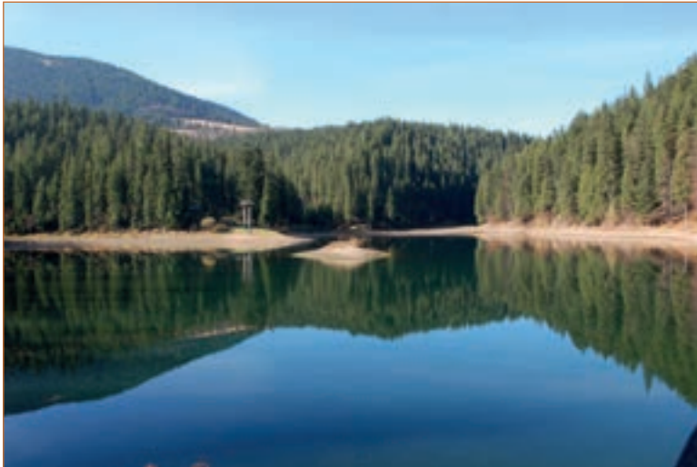
Озеро Синевир. Фото.

Озер в Україні понад 20 тисяч, 43 з них мають площу, яка перевищує 10 квадратних кілометрів. Загальна площа боліт становить 12 тисяч квадратних кілометрів ( Вікіпедія ).