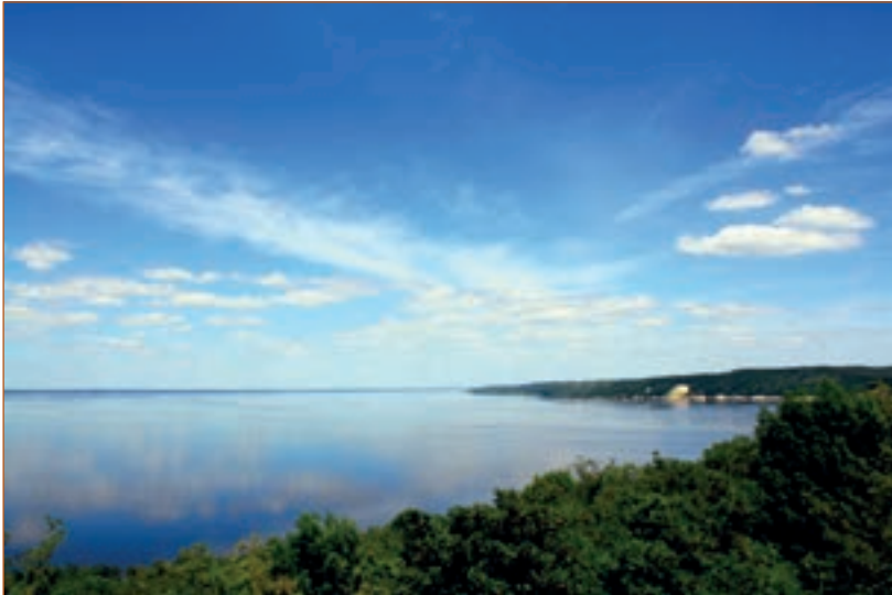
Річка Дніпро. Фото.

В аспекті екологічному Україна сьогодні якоюсь мірою може правити людству за образ недалекого майбутнього, постає моделлю самої планети, що швидко виснажується, де Червоні книги уже не вміщують усіх видів, колись незліченних, флори і фауни, що нині гинуть так бездумно, з такою пожадливістю винищені людиною (О. Гончар).